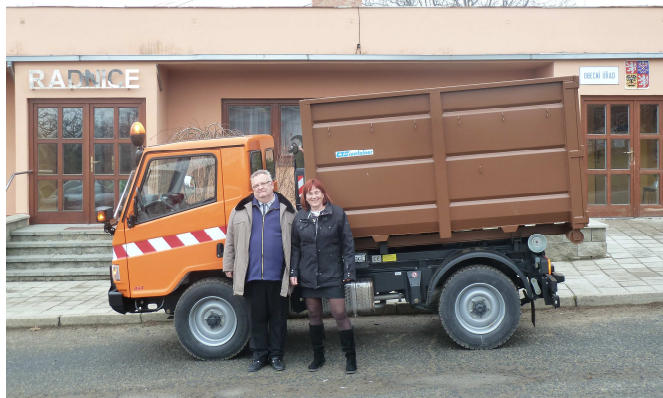
Obrázek č. 1: Nové auto na bioodpad