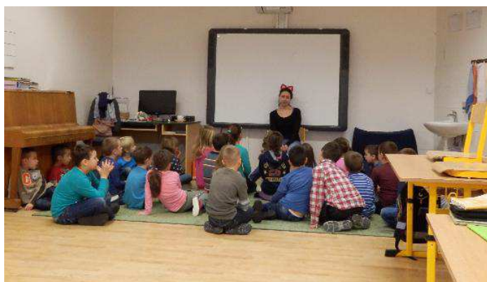
Obrázek č. 6: Zen-Zenovo dobrodružství