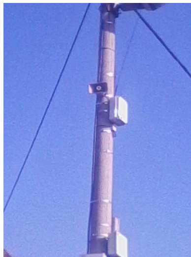
Obrázek č. 2: Bezdrátový hlásič