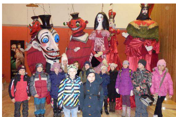
Obrázek č. 7: Výlet