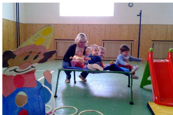
Obrázek č. 9: Děti ve cvičeníčku