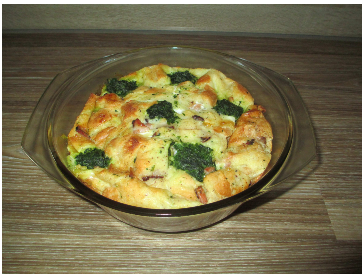
Obrázek č. 14: Jarní nádivka se špenátem