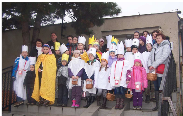
Obrázek č. 4: Tříkrálová sbírka 2014