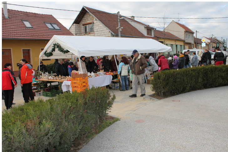
Obrázek č. 12: Adventní jarmark