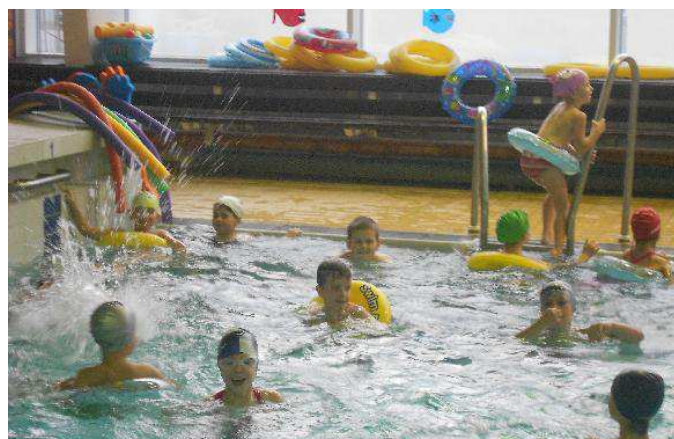
Obrázek č. 5: Škola v plavání