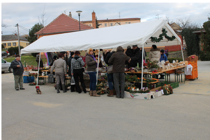
Obrázek č. 13: Jarmark na place