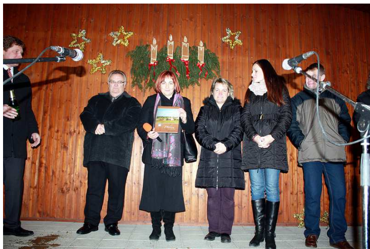
Obrázek č. 10: Křest knihy o Přibicích