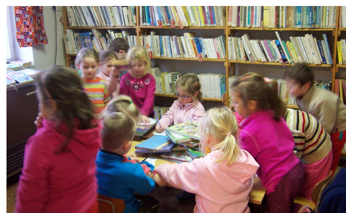
Obrázek č. 8: Děti v knihovně