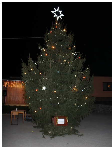
Obrázek č. 15: Vánoční strom na place

Přibický zpravodaj vydává Obecní úřad Přibice. IČO: 00600211. Adresa vydavatele: Přibice 348, 691 24 Přibice. Zaregistrováno Ministerstvem kultury České republiky, reg. značka MK ČR E 20907. Email: zpravodaj@pribice.cz . Tel.: 519 432 223, tel. pro inzerci: 602 645 453. Webové stránky: www.pribice.cz , sekce Zpravodaj. Redakční rada: Marie Bednářová, Pavel Blažek, Jan Čábelka, Ivana Malinová. Společenská rubrika zpracována za období 16. 11. 2013 - 15. 2. 2014. Uzávěrka příštího čísla je 15. 5. 2014. Četnost vydání: čtvrtletně. Publikace neprošla jazykovou úpravou. Toto číslo vyšlo v Přibicích 4. 3. 2014 v nákladu 400 výtisků. Tisk zajišťuje společnost SPIN SERVIS, s.r.o.. Vyhrazujeme si právo redakčně upravit externí příspěvky, nevracem nevyžádané rukopisy a snímky, obdržené materiály nezveřejnit, důvody nezveřejnění nesdělovat. Ceny občanské inzerce: řádková inzerce zdarma, blahopřání a vzpomínky 50 Kč. Ceny komerční inzerce: celá strana 1500 Kč, 1/2 strany 800 Kč, 1/4 strany 500 Kč, 1/8 strany 300 Kč. Ceny jsou včetně DPH 21%. Omezený počet – 10 inzerátů. Autorem fotografie na titulní straně je pan Tomáš Oblezar.