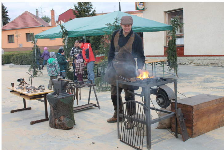
Obrázek č. 11: Ukázka kovářského řemesla