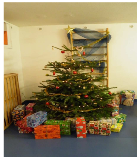
Obrázek č. 3 „Krabice od bot“