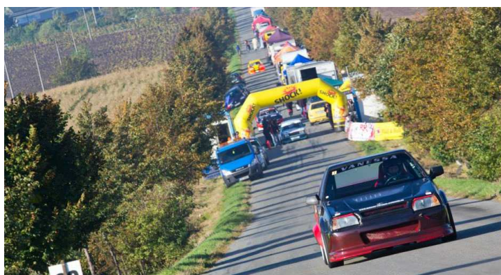
Obrázek 12: Závody na Mohyle Míru