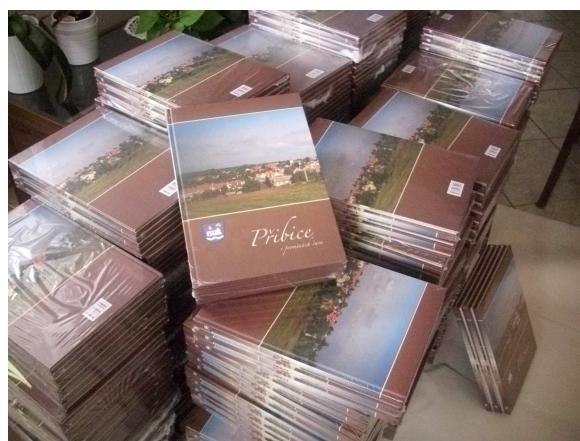
Obrázek 14: Knihy o Přibicích