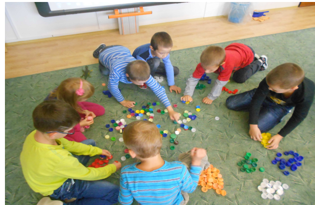
Obrázek 5: Soutěž ve sbírání víček