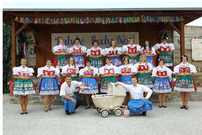
Obrázek 7: Stárky na babských hodech