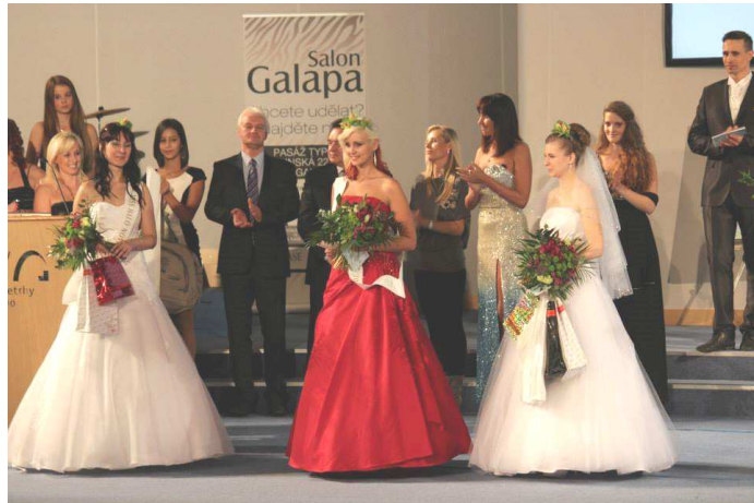
Obrázek 9: Miss Charmé 2013