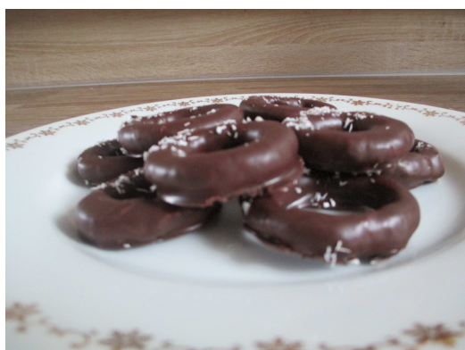
Obrázek 13: Máčené marcipánové věnečky