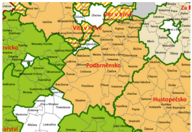
Obrázek 8: Mapa místních akčních skupin