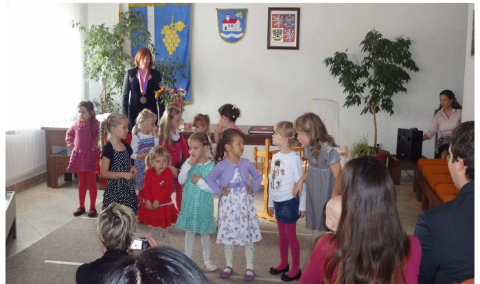
Obrázek 6: Vítání občánků