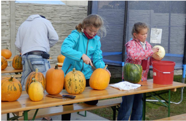
Obrázek 3: Dýňování