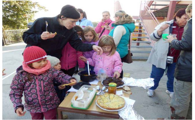
Obrázek 4: Ochutnávka dýňových pochoutek