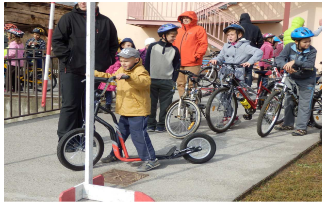
Obrázek 2: Dopravní den