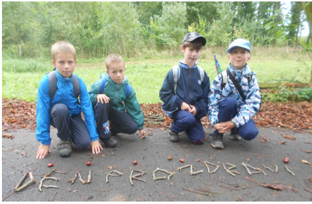
Obrázek 1: Den pro zdraví