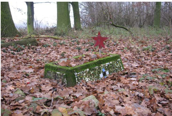
Obr. 12 Památník sovětského vojáka