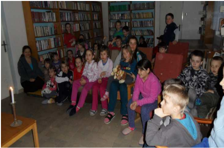
Obr. 8 Noc s Andersenem v knihovně