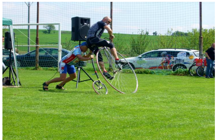
Obr. 11 Zahájení cyklistické sezóny v Přibicích