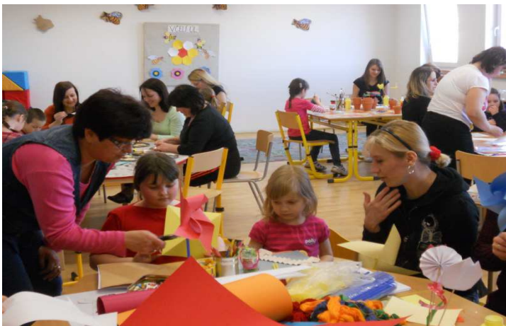
Obr. 10 Jarní dílna