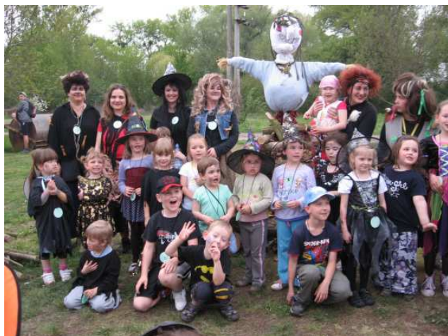
Obr. 6 Pálení čarodějnic