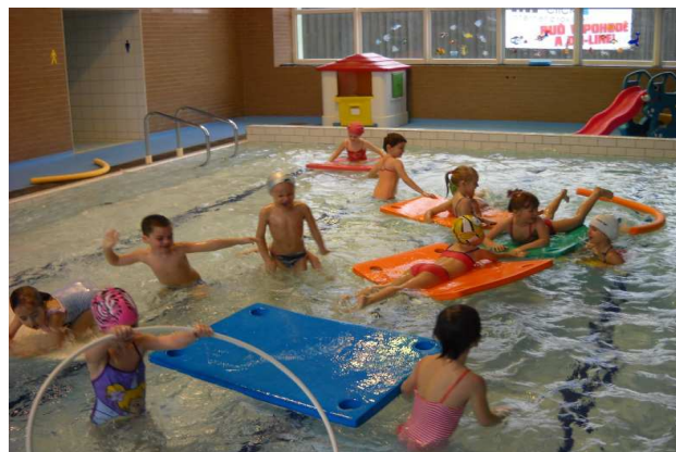
Obr. 5 Děti v plavání