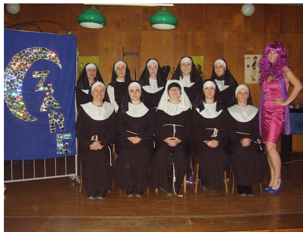
Obr. 7 Divadelní spolek