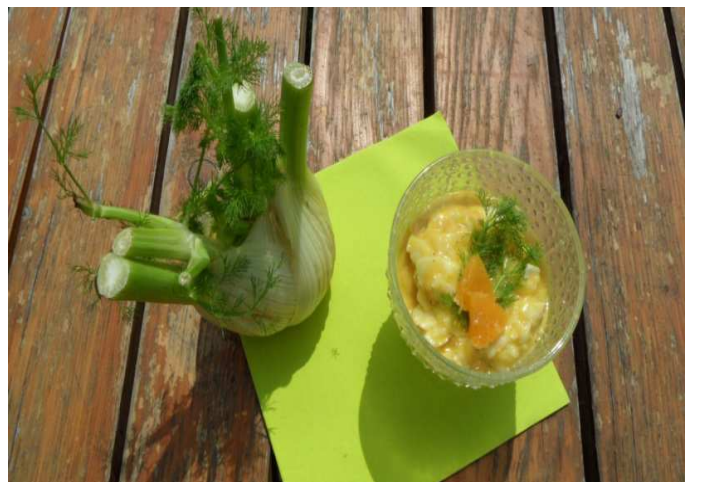
Obr. 13 Fenyklový salát