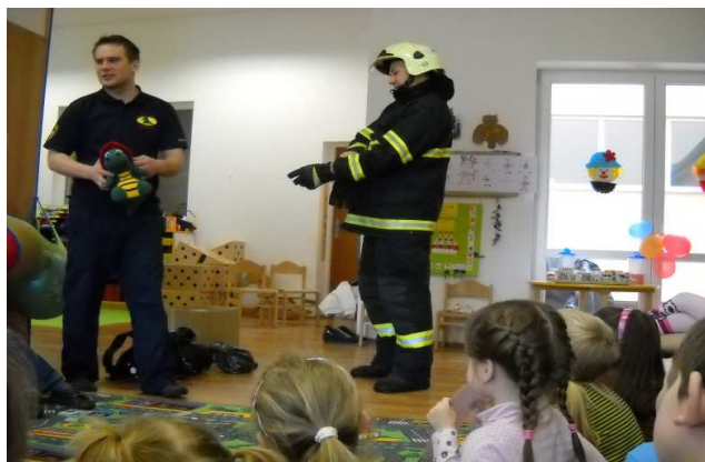
Obr. 4 Den s hasičským sborem