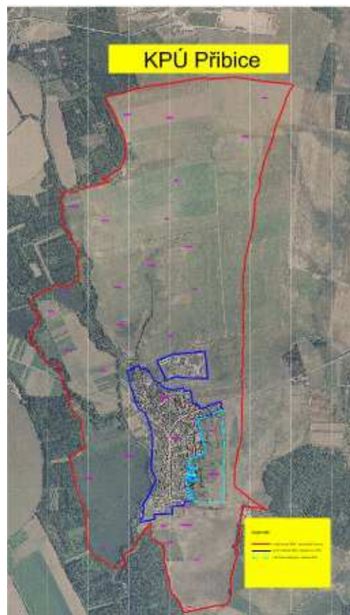
Obr. 3 Mapa obvodu KPÚ Příbice