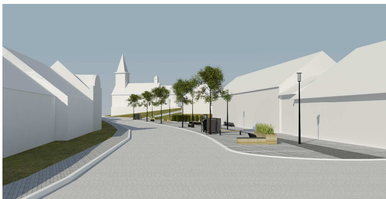
Obr. 2 Perspektiva kulturního centra obce 2