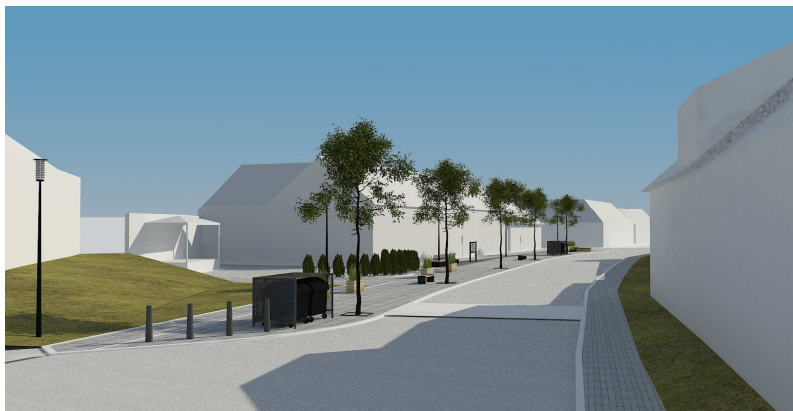
Obr. 1 Perspektiva kulturního centra obce 1