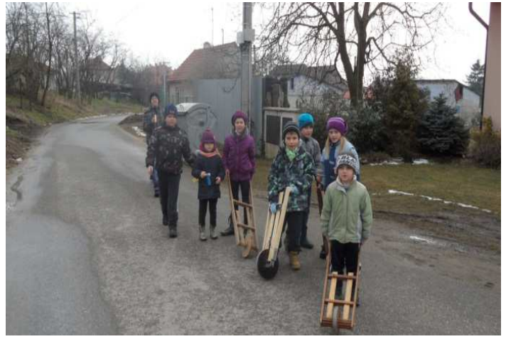
Obr. 9 Hrkači