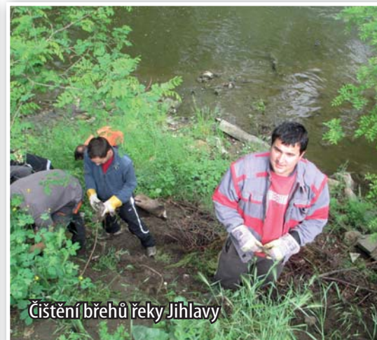
Čištění břehů řeky Jihlavy

modelu „Let's do it!“. Tento typ akcí již proběhl úspěšně ve více než 100 zemích světa za účasti devíti milionů dobrovolníků, v České republice se však konala poprvé. Zapojilo se tu asi 300 organizá-