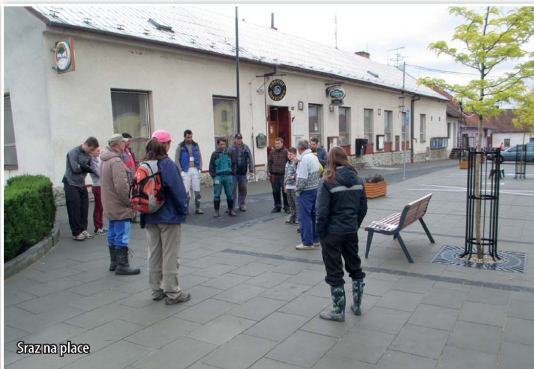
Sraz na place

Úklidová akce s názvem „Uklidme Česko“ vychází z mezinárodně osvědčeného