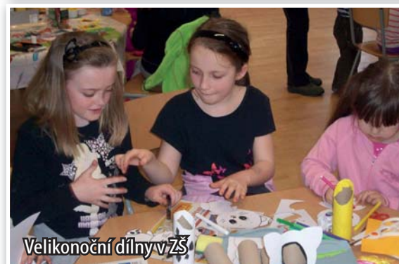
Velikonoční dílny v ZŠ