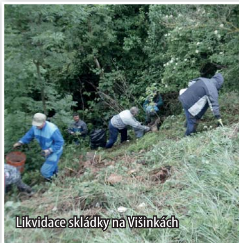
Likvidace skládky na Višinkách