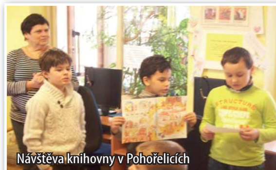
Návštěva knihovny v Pohořelících