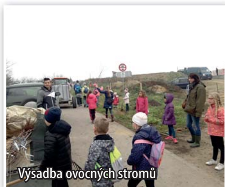
Výsadba ovocných stromů

Společně s dobrovolníky z řad veřejnosti a zejména dětmi z místní školy jsme vysadili desítky ovocných stromů podél cyklostezky na Svobodném Hájku směrem na Vranovice. Brzy tak budeme moci sklízet třeba třešně, švestky nebo moruše. Vysazeny byly také lípy. Výsadbu celkem 35 stromů obecní pokladna nestálo ani korunu, protože výdaje v plné výši pokryla dotace z místní akční skupiny Podbrněnsko.