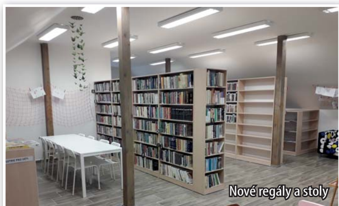
Nové regály a stoly