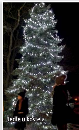
Jedle u kostela