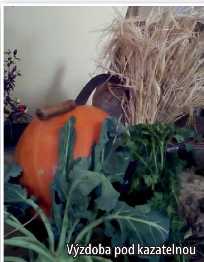
Výzdoba pod kazatelnou