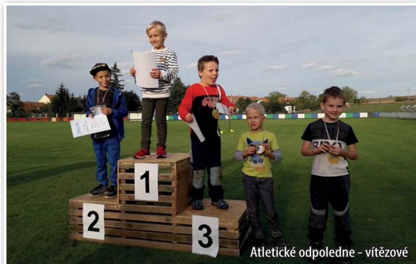
Atletické odpoledne - vítězové