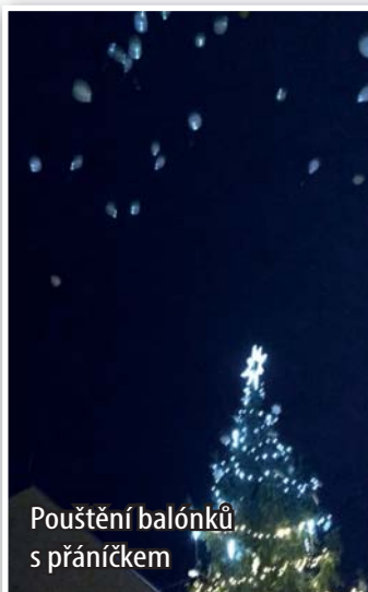
Pouštění balonků s přáníčkem