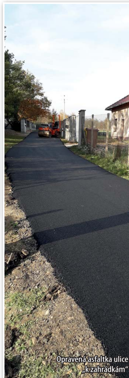
Opravená asfaltka ulice „k zahrádkám“