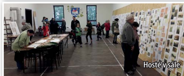
Hosté v sále