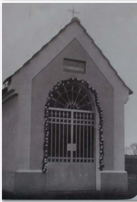
Fotografie ze svěcení kaple Ke cti a chvále Boží v roce 1937

Účet za stavbu kaple Ke cti a chvále Boží. K této částce je ještě potřeba přičíst koupi 10 m 2 obecního pozemku za 30 Kč a několik úředních poplatků.