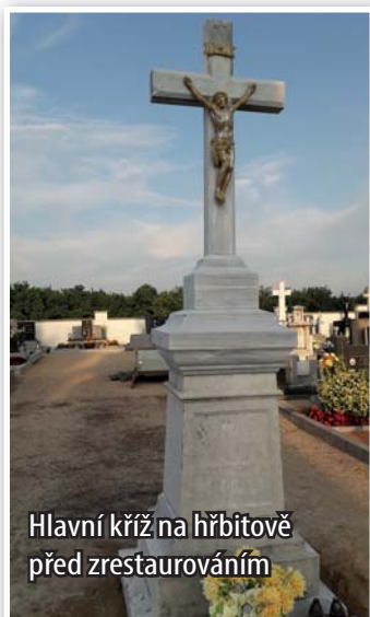
Hlavní kříž na hřbitově před zrestaurováním

Kamenictví Nečesal – Zmeškal provedlo opravu hlavního kříže na místním hřbitově. Došlo ke kompletnímu přebroušení stávajícího kříže s podstavcem. Křížem tím byl navrácen původní lesk. Došlo také k obnově písma a pozlacení Krista.