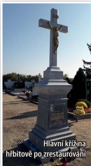
Hlavní kříž na hřbitově po zrestaurování