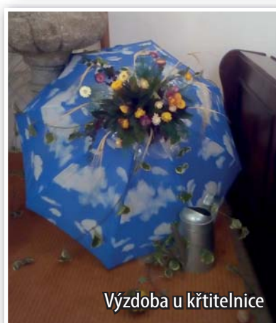
Výzdoba u křtitelnice