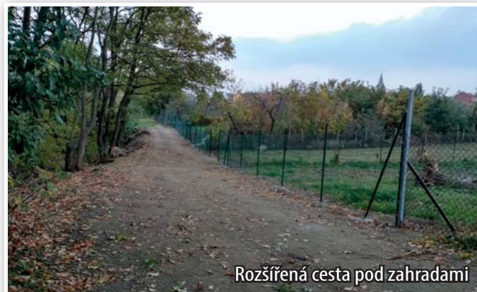
Rozšířená cesta pod zahradami