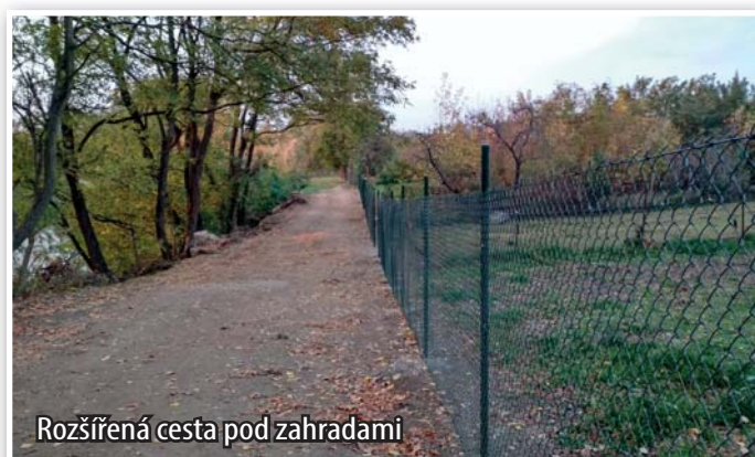
Rozšířená cesta pod zahradami

Po dokončení výkupu pozemků se podařilo dokončit také nové oplocení zahrad u řeky. Pohodlně a bezpečně se tak můžete vydat od uličky „u schodků“ až k rybníku na Lúži.