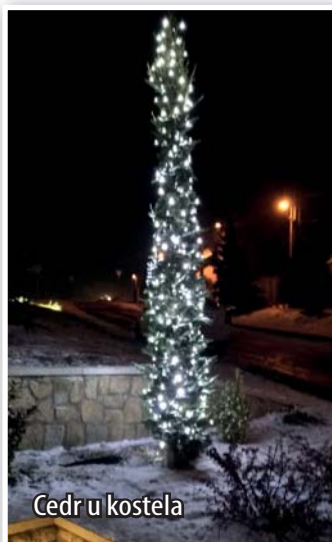
Cedr u kostela