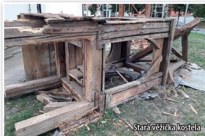
Stará věžička kostela

Díky dotaci od ministerstva, kraje a obce se farnosti letos podaří dokončit opravu malé věže kostela. Původní věž byla odstraněna a podle ní byla vyhotovena věž úplně nová. Opraveny byly rovněž i kostelní varhany, které se rozezněly už před adventem.