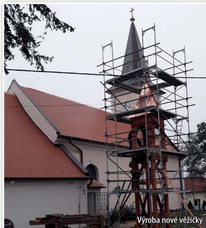
Výroba nové věžičky