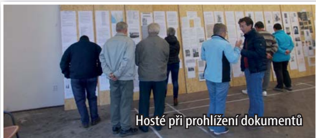
Hosté při prohlížení dokumentů