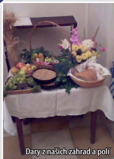
Dary z našich zahrad a polí