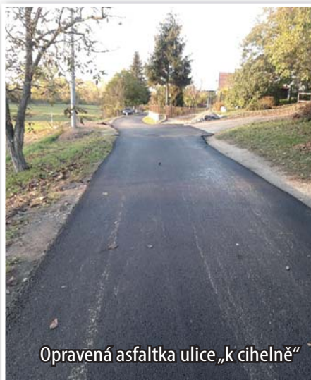
Opravená asfaltka ulice „k cihelně“

Než přišly první mrazy, stihla se provést část oprav místních komunikací. Byly provedeny zejména v místech, kde byl stav nejhorší. Jednalo se o úseky hlavně s propadlými místy po kanalizaci v ulicích Sliníku – „k cihelně“, „k zahrádkám“, „ke kolejím“. Opravena byla část ulice u Těšiny nebo překopy v ulici k lokálce. Nový povrch byl položen v II. etapě Svobodného Hájku.