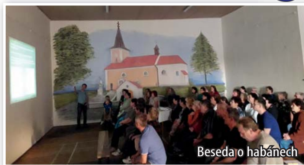
Beseda o habánech