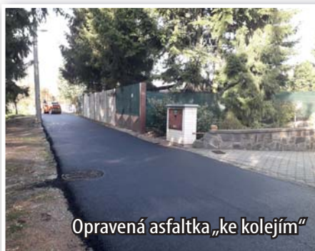
Opravená asfaltka „ke kolejím“

Díky dotaci se dokončuje další etapa rozšíření dětského hřiště u lokálky. Kromě prvků pro děti byla instalována i cvičební sestava pro všechny věkové skupiny a na novém zařízení budou moci cvičit i senioři.