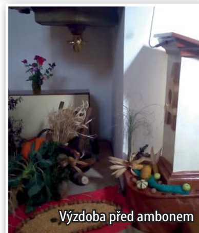
Výzdoba před ambonem