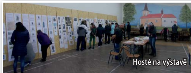
Hosté na výstavě