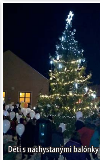
Děti s nachystanými balonky