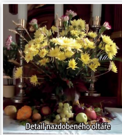
Detail nazdobeného oltáře