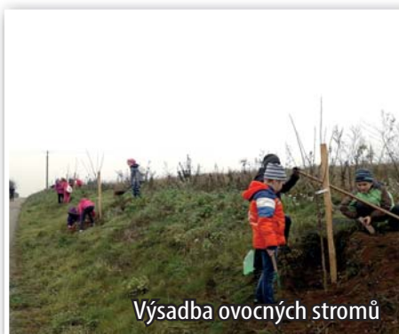
Výsadba ovocných stromů