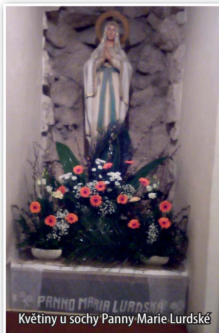
Květiny u sochy Panny Marie Lurdské