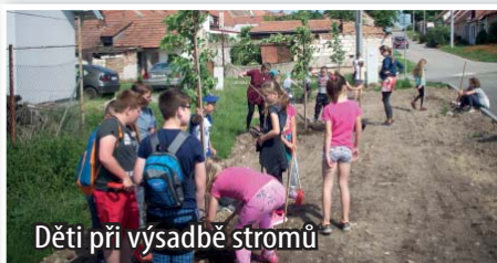
Děti při výsadbě stromů