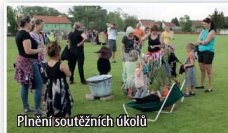
Plnění soutěžních úkolů