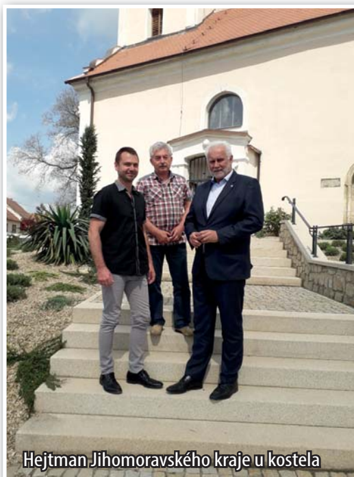
Hejtman Jihomoravského kraje u kostela