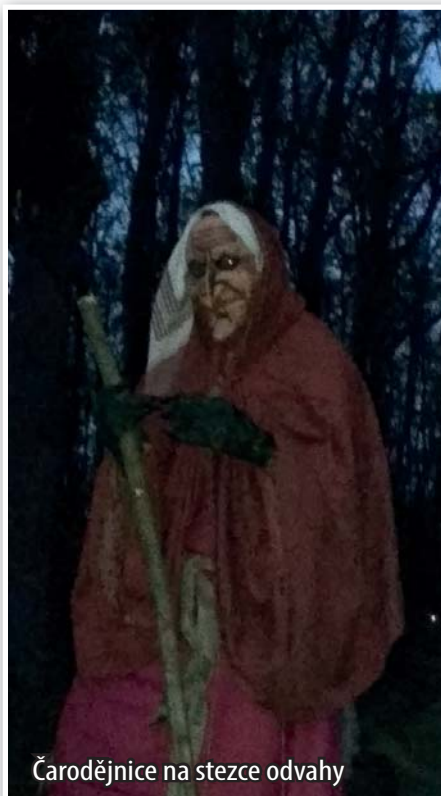
Čarodějnice na stezce odvahy