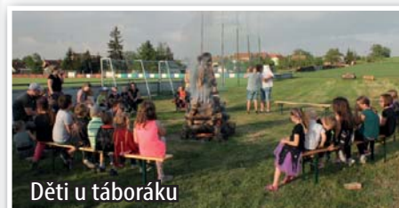
Děti u táboráku