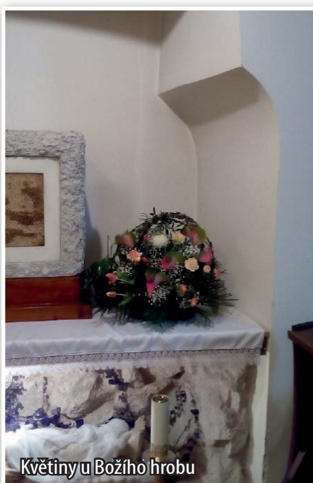
Květiny u Božího hrobu