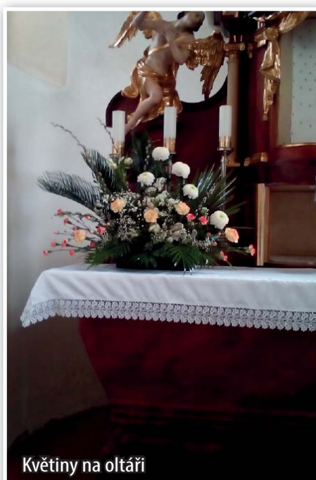
Květiny na oltáři