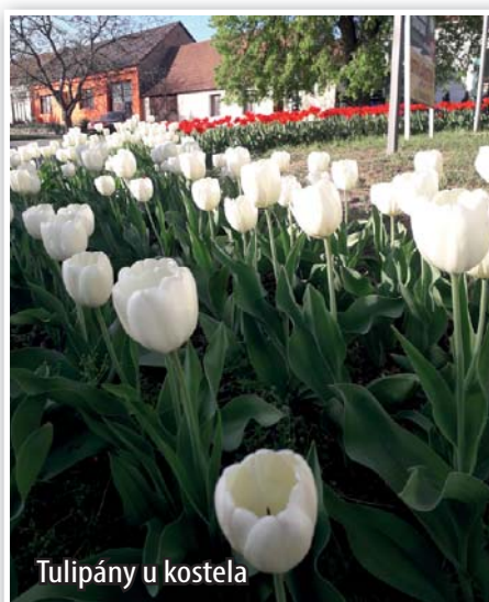
Tulipány u kostela