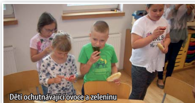
Děti ochutnávají ovoce a zeleninu