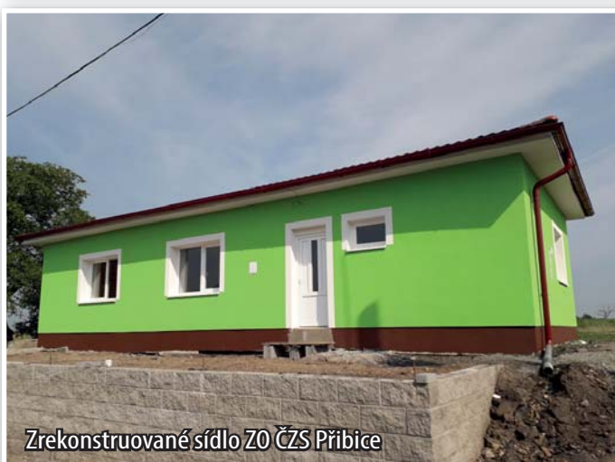
Zrekonstruované sídlo ZO ČZS Přibice