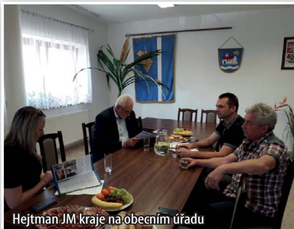
Hejtmán JM kraje na obecním úřadu

pro komunitní dům a bydlení pro seniory, kterému pan hejtmán vyjádřil podporu už při předchozím jednání na půdě krajského úřadu.