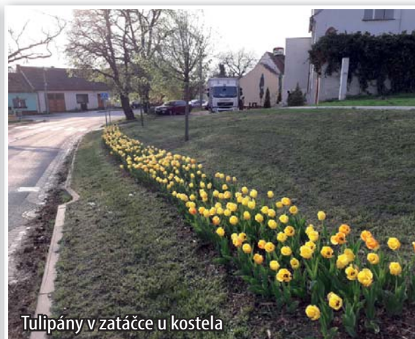
Tulipány v zatáčce u kostela