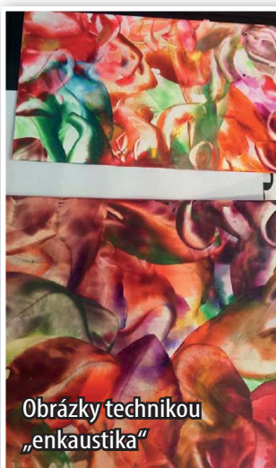
Obrázky technikou „encaustika“