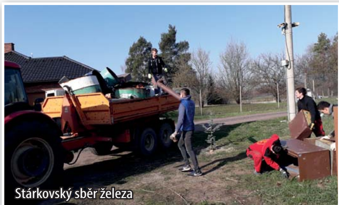
Stárkovský sběr železa

Stárkovský sběr železa letos proběhl 7. dubna 2018. Za posbíraný a vykoupený železný šrot se utržilo přes 30 tisíc Kč, které budou použity jako jeden ze zdrojů financování letošních hodů.