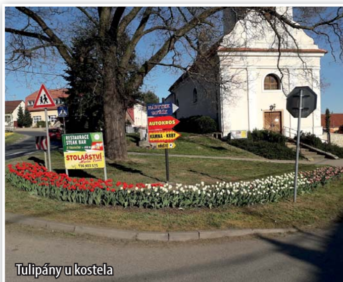
Tulipány u kostela