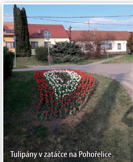
Tulipány v zatáčce na Pohořelice