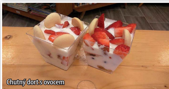
Chutný dort s ovocem

ci hráli hry. Pak už se venku pěkně setmělo, a my jsme se vydali na stezku odvahy. Nakonec následoval přesun zpět do knihovny, kde jsme si losovali z krabice lístečky a podle krátkého úryvku jsme měli za úkol uhodnout příslušnou knihu. Děti byly na hádání velice šikovné a nejlepší hadačka byla odměněna čokoládovou medailí. Kolem půlnoci se četly horory a pohádky, ale děti byly stále neúnavné a spát se šlo až kolem druhé hodiny ranní! A brzo se i vstávalo - v šest hodin ráno! Dali jsme si ke společné snídani buchty, které napekly maminky, potom ranní rozcvičku v parku, a jako správní pejsci a kočičky jsme si upekli opravdický dort. Ingredience jsme vyčmuchali na obecním úřadě a dali jsme se do pečení a zdobení vlastních dortíků. Nakonec jsme si uklidili své spacáky, rozdali pamětní průkazy a vydali jsme se domů.