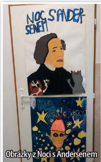
Obrázky z Noci s Andersenem

řekli pár vět. Následovala pohádka o tom, jak pejsek a kočička pekli dort. Poté jsme si rozdali pracovní listy, do kterých jsme měli na základě přečtené pohádky doplňovat správné informace. Dalším úkolem bylo zapamatovat si, co pejsek s kočičkou dali do dortu a ingredience správně nalepit do pracovního listu. Nejlepší byli odměněni čokoládovými medailemi. A jelikož venku bylo nádherné počasí, děti si přály jít na hřiště do parku nad knihovnou. Tam se všichni vyřadili a opět jsme se přesunuli do knihovny, kde jsme si dali večer. Jako zpestření jsme vyráběli indiánské členky a lapače snů, které měly zachytit škaredé sny. To zaujalo spíše holčičky, a tak klu-