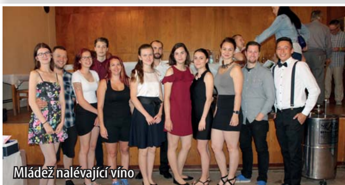
Mládež nalévající víno