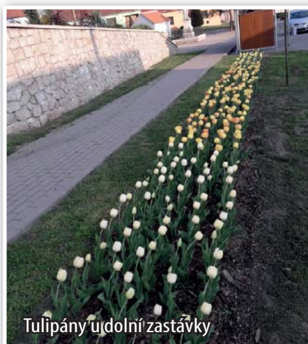
Tulipány u dolní zastávky

Letošní jaro bylo v centru obce neobvykle barevné. Oživit a zkrášlit veřejná prostranství se podařilo díky 4 000 tulipánů přímo z Holandska. Vysazeny byly už loni v létě. Nejedno projíždějící auto přibrzdilo za účelem nafocení přibické krásy.