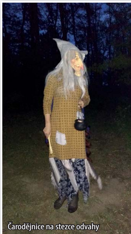
Čarodějnice na stezce odvahy

Tradičně se konala v poslední dubnový den akce pálení čarodějnic. Pro děti byly připraveny soutěže, táborák a pro ty odvážnější i stezka odvahy v lese.