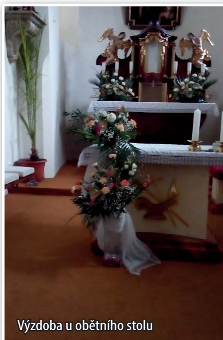
Výzdoba u obětního stolu