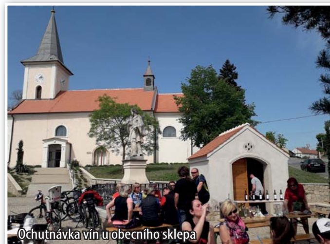
Ochutnávka vín u obecního sklepa