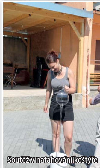
Soutěž v natahování košťře