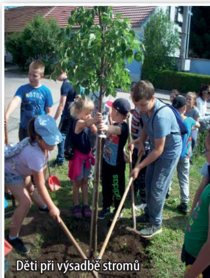
Děti při výsadbě stromů

Po celý rok do naší školy dodává ovoce, zeleninu a mléčné výrobky firma Laktea. Dodávky jsou zdarma. Cílem projektu je zvýšit oblibu ovoce a zeleniny, vytvoření stravovacího návyku ve výživě dětí, zlepšit zdravotní stav mladé populace, bojovat proti dětské obezitě.