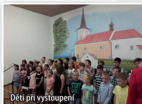
Děti při vystoupení