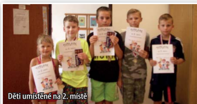
Děti umístěné na 2. místě