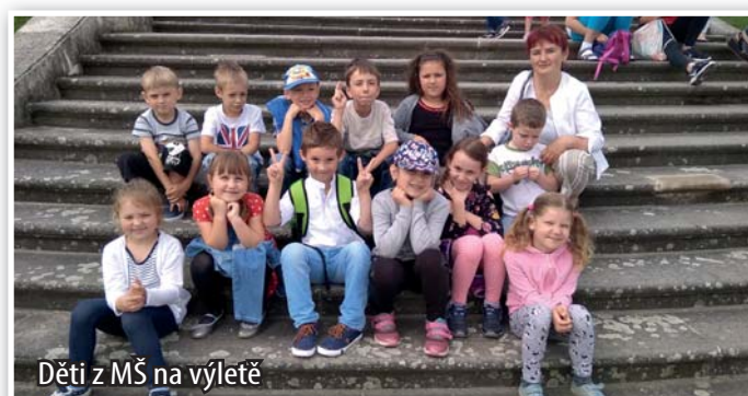
Děti z MŠ na výletě