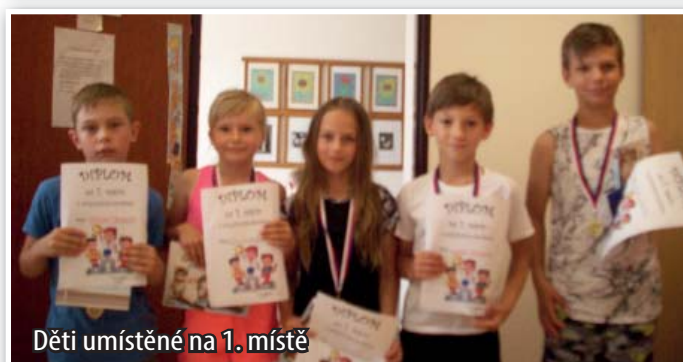
Děti umístěné na 1. místě