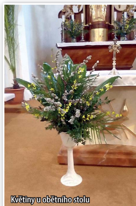
Květiny u obětního stolu