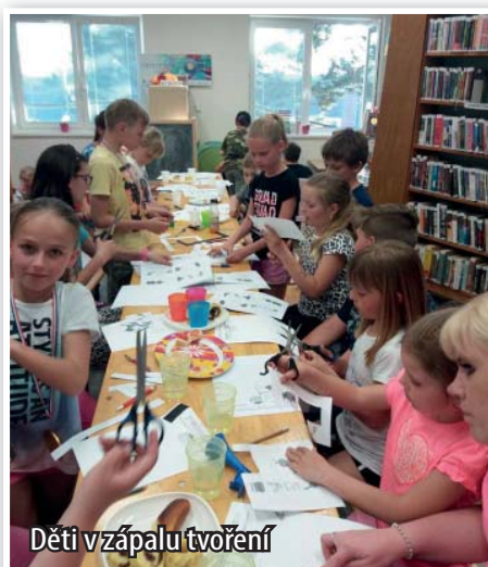
Děti v zápalu tvoření