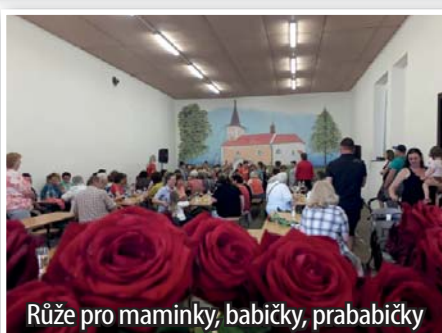
Růže pro maminky, babičky, prababičky