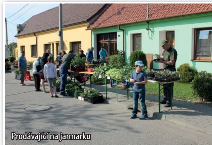
Prodávající na jarmarku