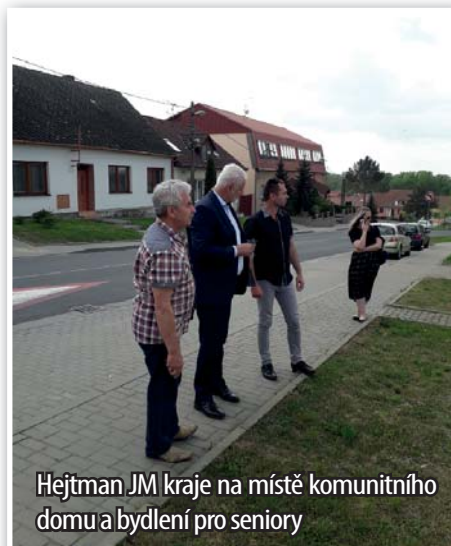
Hejtmán JM kraje na místě komunitního domu a bydlení pro seniory