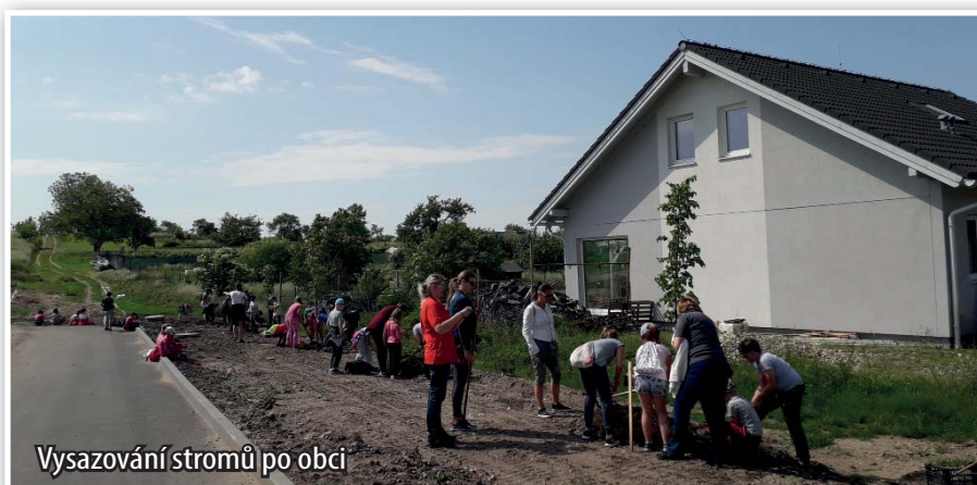
Vysazování stromů po obci

V rámci akce Naše stromy 2018 bylo ve spolupráci s dětmi z místní školy vysazeno 40 stromů na veřejná prostranství v obci. Jednalo se zejména o