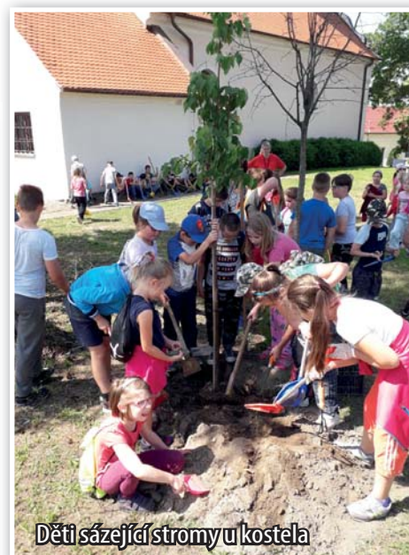
Děti sázející stromy u kostela