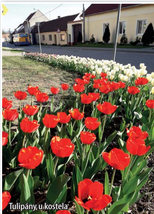
Tulipány, u kostela