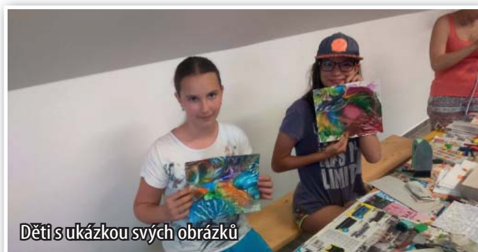
Děti s ukázkou svých obrázků

Děkuji všem rodičům a dobrovolníkům, kteří si udělali čas a pomohli při přípravě Andersenovské noci, napekli buchty, přespali jako dozor v knihovně či se jakkoliv zapojili. Všem obrovské DÍKY!