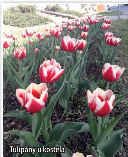
Tulipány u kostela