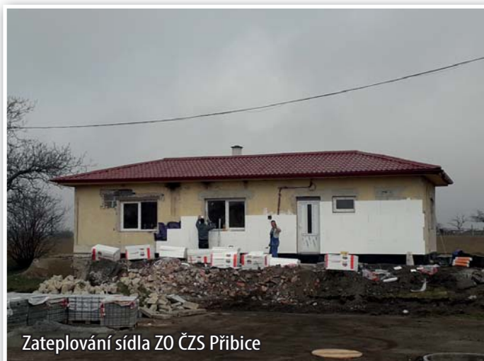
Zateplování sídla ZO ČZS Přibice

Před budovou byla vystavěna zídka ze štípaných betonových tvárnic. Mezi ní a budovou přibude ještě v brzké době terasa.