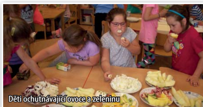
Děti ochutnávají ovoce a zeleninu