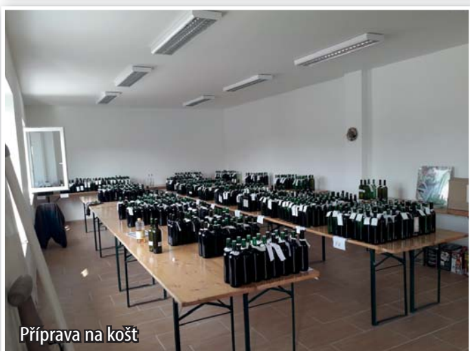
Příprava na košť