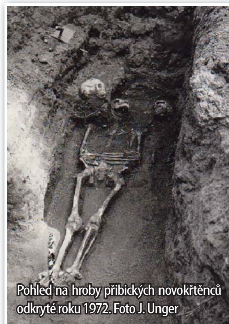
Pohled na hroby přibických novokřtěnců odkruté roku 1972.