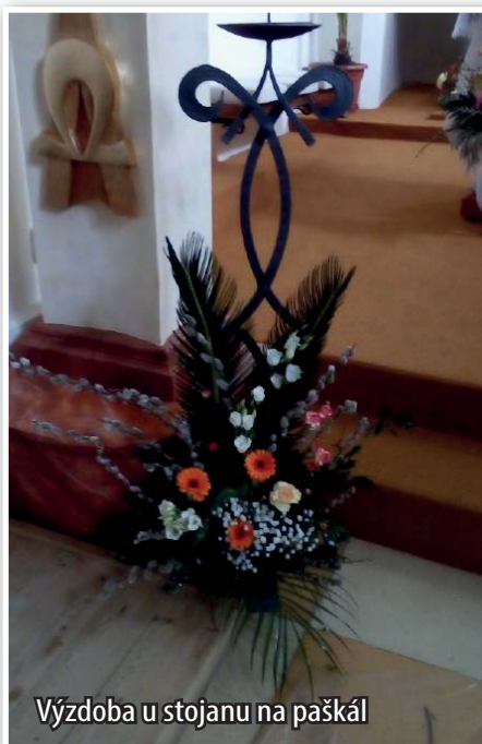
Výzdoba u stojanu na paškál