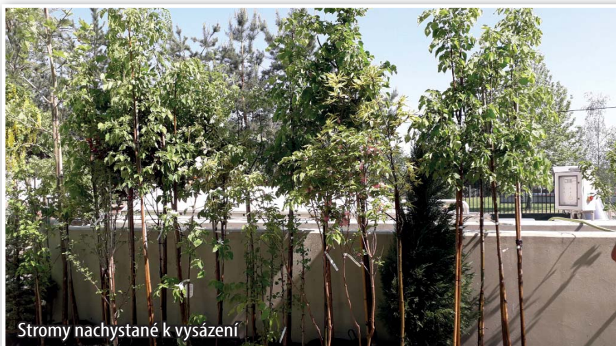
Stromy nachystané k výsázení

lípy, a to v počtu 13 kusů, dále jedlé kaštanovníky, ginkga, svídy, ibišky, oskeruše, cedry, platan nebo cypřiš. Později budou dosazeny i ořešáky nebo motýlí keře. Děti si výsadbu doslova užívaly.