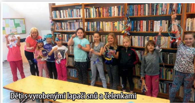
Děti s vyrobenými lapači snů a čelenkami