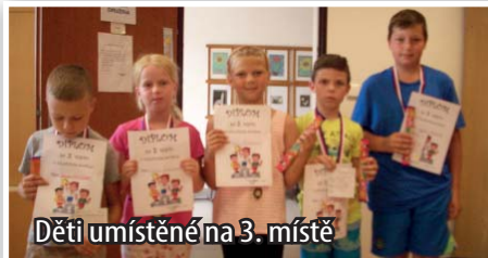
Děti umístěné na 3. místě