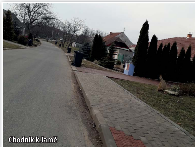
Chodník k Jamě