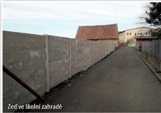
Zed' ve školní zahradě

V průběhu prosince byl proveden nový betonový plot ve školní zahradě, na nákladech se podílel majitel sousední zahrady. Děti tak budou více v bezpečí a nebude hrozit zranění z rozpadávajícího se cihlového plotu nebo poškrábání od zdevastovaného drátěného oplocení.