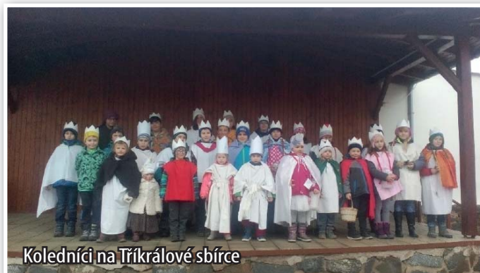
Koledníci na Tříkrálové sbírce