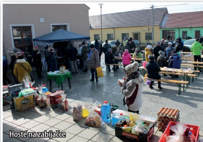
Hosté na zabíjačce