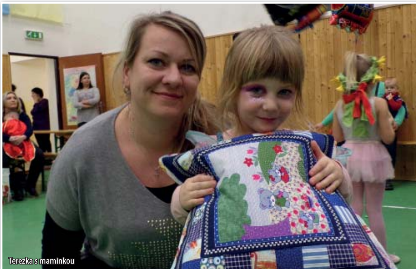
Terezka s maminkou