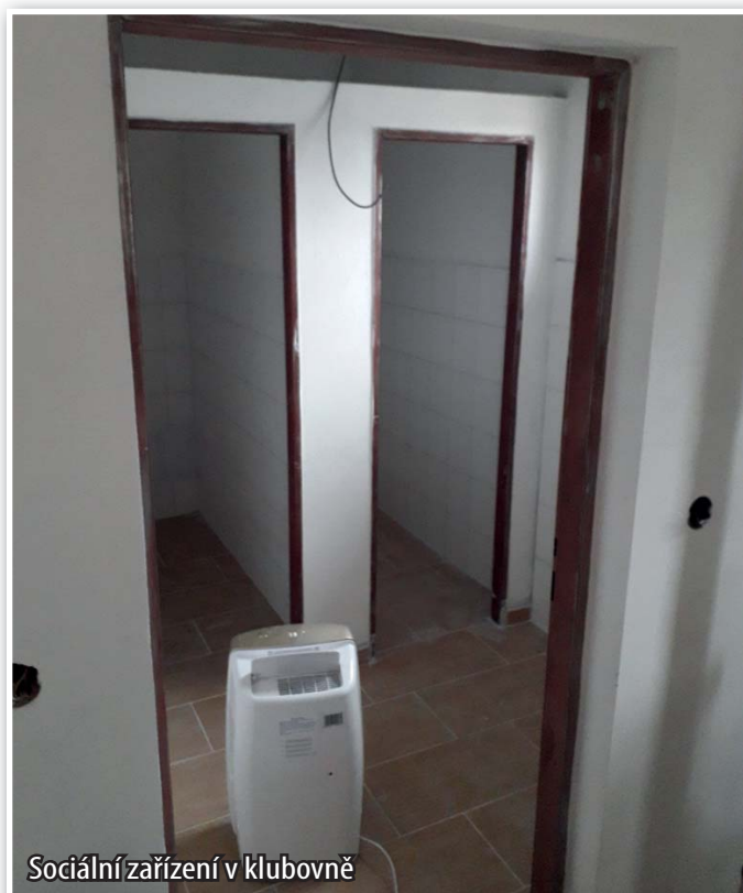
Sociální zařízení v klubovně

Stavební práce uvnitř byly již dokončeny, v prostorách se nachází nyní velká společenská místnost s kuchyňkou a sociálním zařízením. Budova ještě dostane po zateplení zvenčí i novou fasádu.