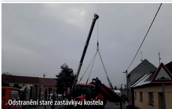
Odstranění staré zastávky u kostela

Z důvodu neustále poničených skel, kde je jejich výměna dost nákladná, byla odstraněna zastávka dole u kostela a