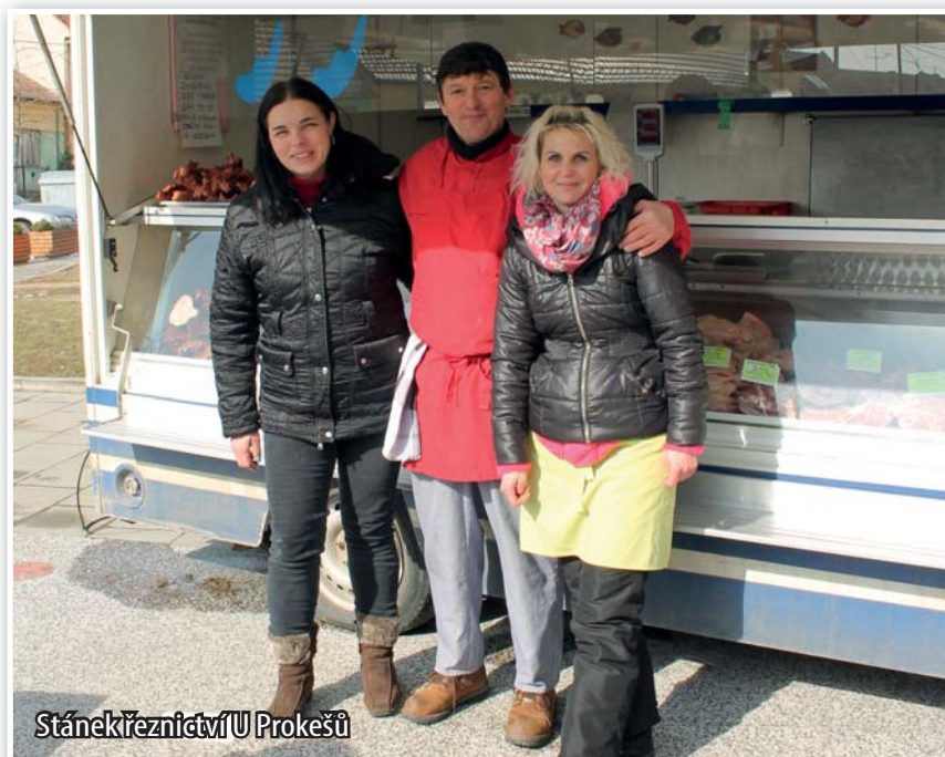
Stánek řeznictví U Prokešů