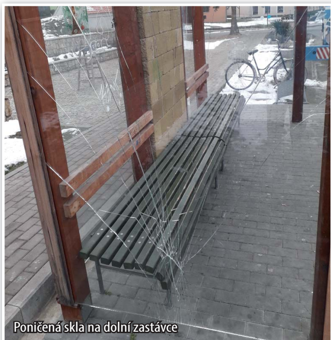
Poničená skla na dolní zastávce

Prakticky veškerá činnost v obci je prováděna svépomocí, čímž dochází k úspoře finančních prostředků.