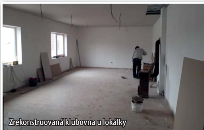
Zrekonstruovaná klubovna u lokálky