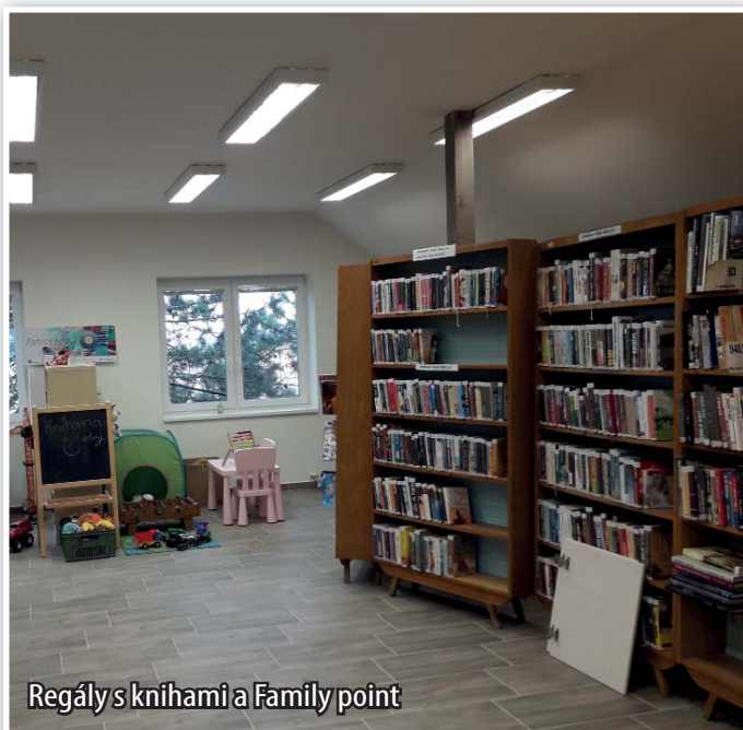
Regály s knihami a Family point

Pojďme si tedy alespoň připomenout, co vše se v knihovně událo za dobu jejího uzavření. S rekonstrukcí se začalo zhruba v polovině července loňského roku. Prvně bylo vystěhováno a uzavřeno dětské oddělení, probourány sklady, vybudovány prozatímní vchodové dveře a pomalu se začalo rýsovat první patro. V říjnu dostala knihovna novou střechu a nová plastová okna.