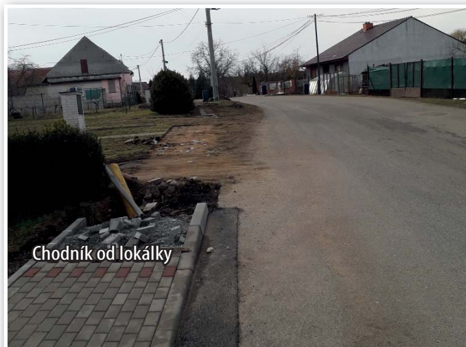
Chodník od lokálky