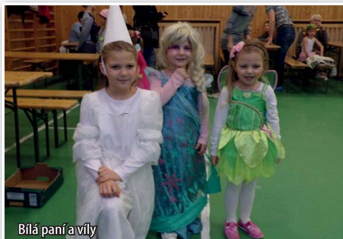
Bílá paní a víly