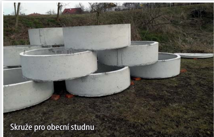
Skrže pro obecní studnu

V lokalitě Lůža bude vybudována obecní studna, která