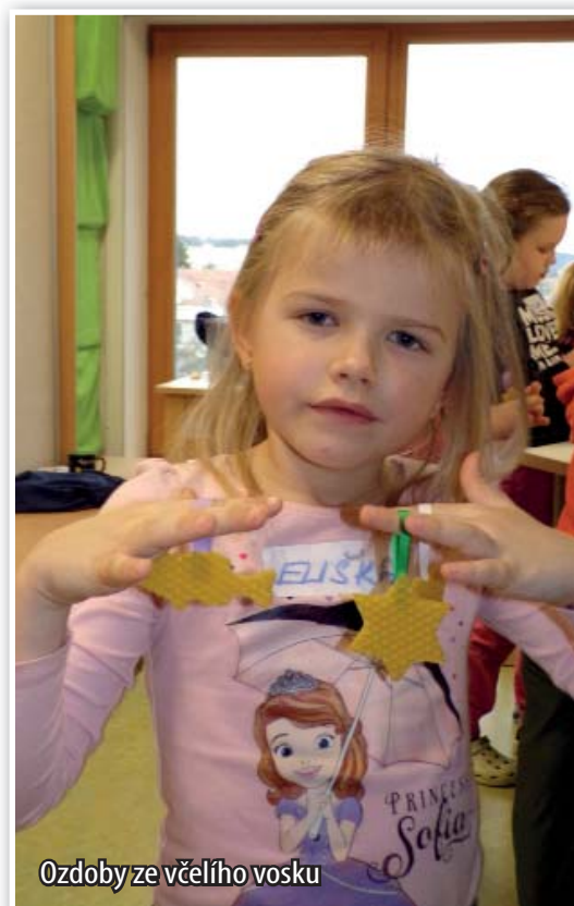
Ozdoby ze včelího vosku