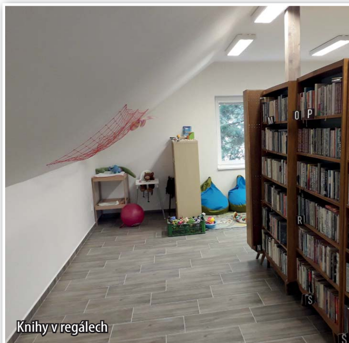
Knihy v regálech