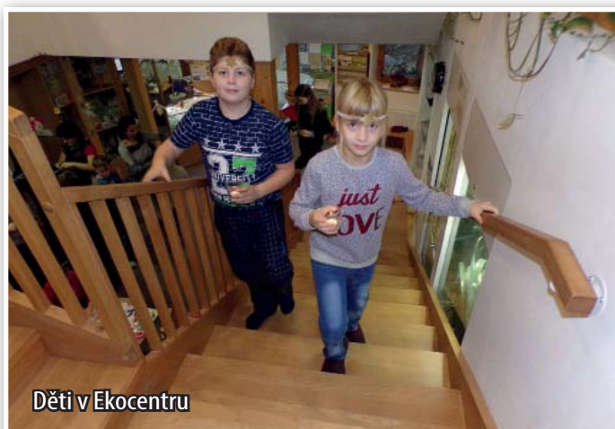
Děti v Ekocentru