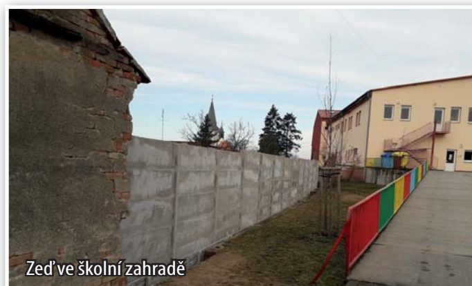
Zed' ve školní zahradě