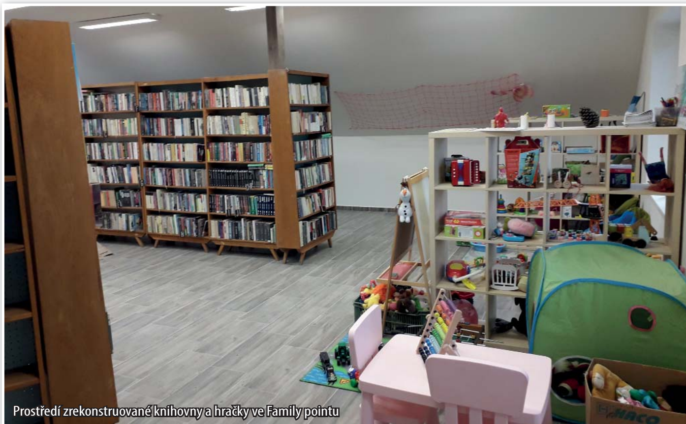
Prostředí zrekonstruované knihovny a hračky ve Family pointu