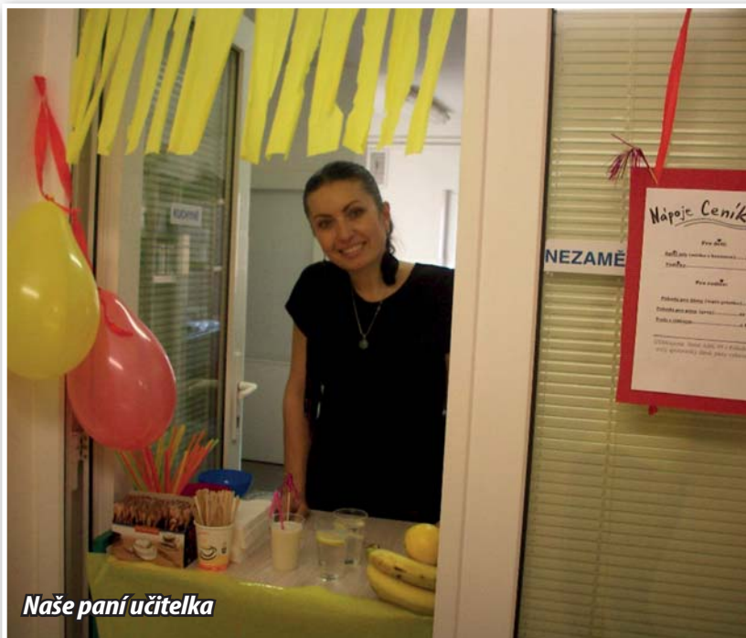
Naše paní učitelka