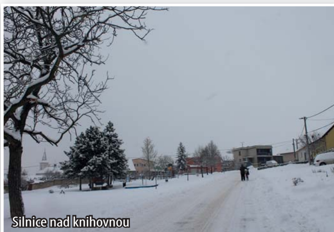
Silnice nad knihovnou