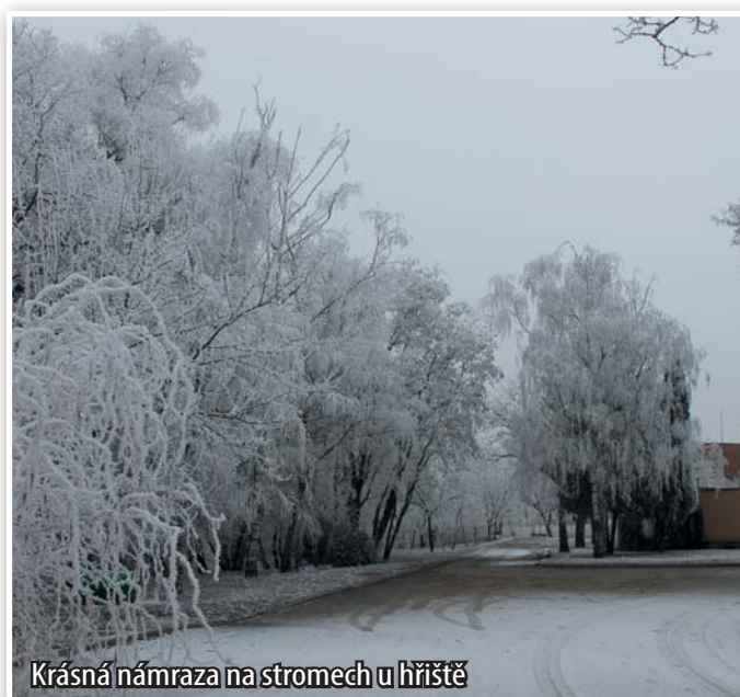
Krásná námraza na stromech u hřiště