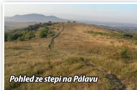
Pohled ze stepi na Pálavu

ději, že cíl mé cesty už nebude daleko. A skutečně, po několika minutách se přede mnou objevil výhled na toužebně očekávanou železniční trať, která mě po celodenním toulání vyprahlou stepí zavedla zpět domů. Na první pohled se tato historka o dobrodružné výpravě se šťastným koncem může zdát jako scéna vystřižená z nějaké kovbojky odehrávající se ve stepích amerického divokého západu. Vždyť i cíl této výpravy byl stejný jako v dobách osadníků kolonizujících severní Ameriku, a to prozkoumat okolní krajinu. Podstatný rozdíl byl však v tom, že se nejednalo o step americkou, ale jednu z nejvýznamnějších stepí v České republice, nacházející se nedaleko