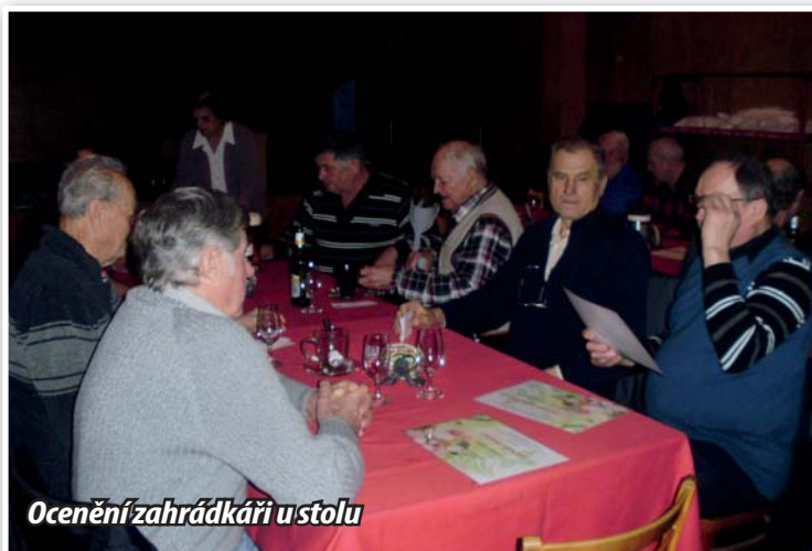
Ocenění zahrádkářů u stolu