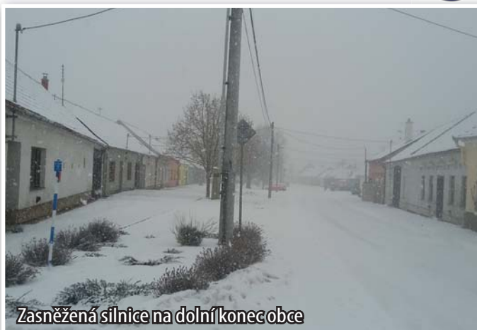
Zasněžená silnice na dolní konec obce