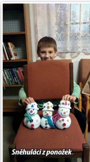
Sněhuláci z ponožek

Další akcí, která je pro naše malé čtenáře připravena, je již 5. ročník Noci s Andersenem, která se letos bude konat v pátek 31. března 2017. Přihlášky si již nyní můžete vyzvednout v knihovně. Bližší informace budou později upřesněny na webu knihovny.