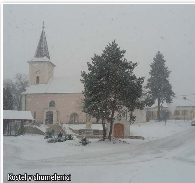
Kostel v chumelenici