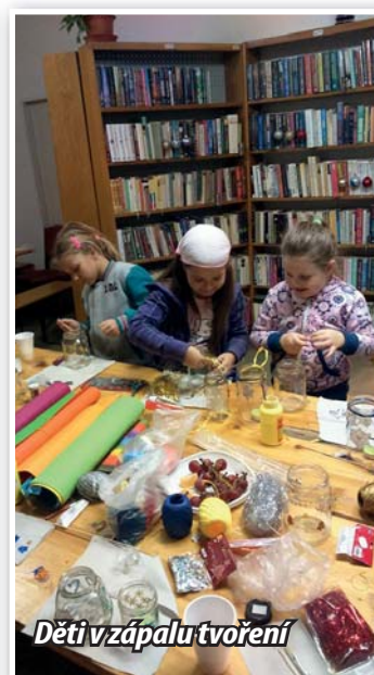
Děti v zápalu tvoření

Do knihovny byly z prostředků obce nakoupeny nové knihy. Jde celkem o 41 nových titulů z různých oblastí. Děti si mohou přijít půjčit oblíbený Klub Tygrů od Thomase Breziny a starší čtenáře snad nalákám na tyto knihy: