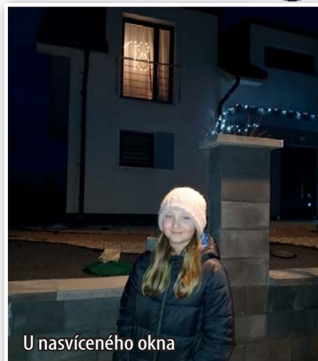
U nasvíceného okna