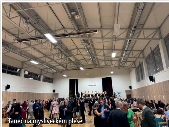
Tanec na mysliveckém plesu