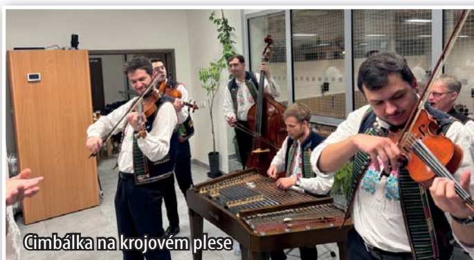
Cimbálka na krojovém plesu

V sobotu, dne 22. února, se uskutečnil již čtvrtý přibický krojový ples. Muzika začala hrát v sedm hodin večer, avšak už od šesté hodiny večerní se stoly v sále plnily. Hned u vchodu bylo možné si zakoupit plesovou skleničku a nahlédnout do naší chasovní kroniky. Večerem nás provedli perfektní DH Vacenovjáci a CM Lašár. Účast byla velice hojná, krojovaných bylo nespočet. V průběhu akce zatančili místní i přespolní moravskou besedu, které se zúčastnilo neuvěřitelných devět koleček, to je 72 osob. Dále si návštěvníci mohli zakoupit tombolu, zatančit si na korkovém sóle, zazpívat s cimbálkou, ochut-