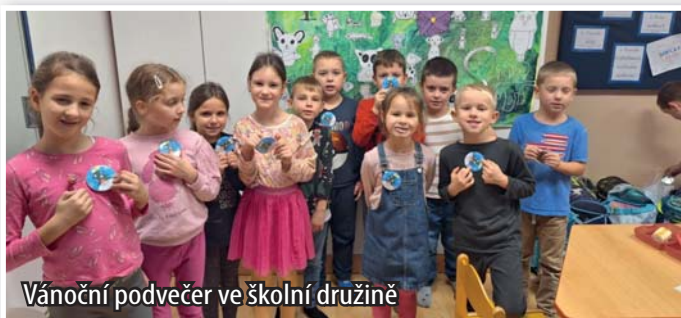
Vánoční podvečer ve školní družině