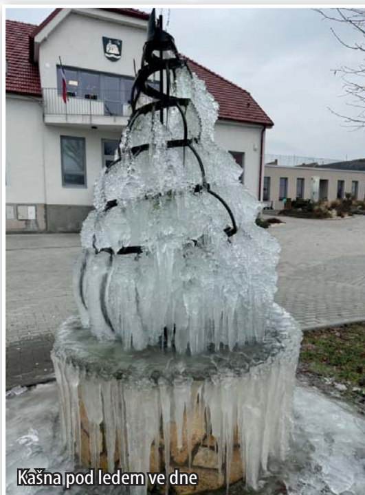
Kašna pod ledem ve dne