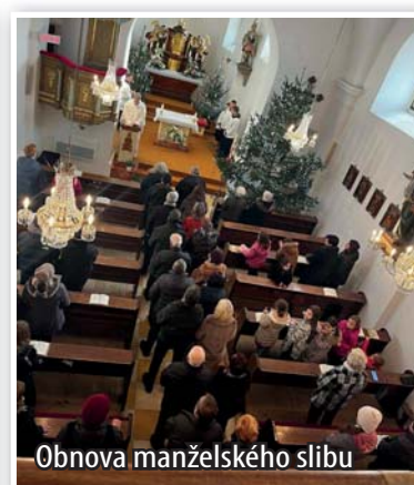
Obnova manželského slibu