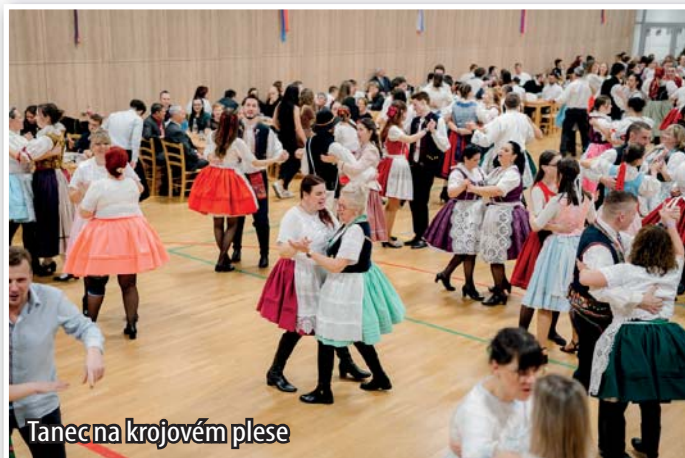
Tanec na krojovém plese