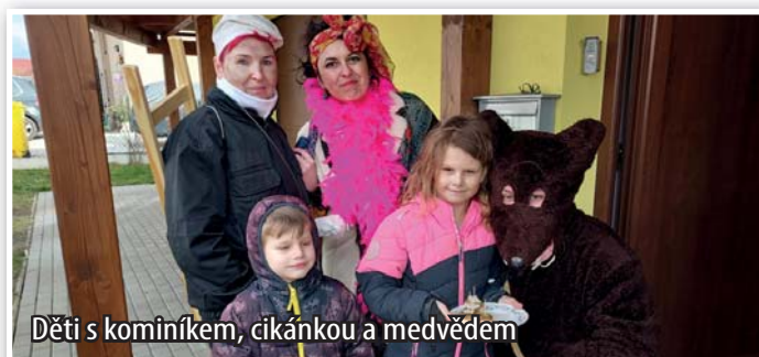
Đeti s komíníkem, cikánkou a medvědem