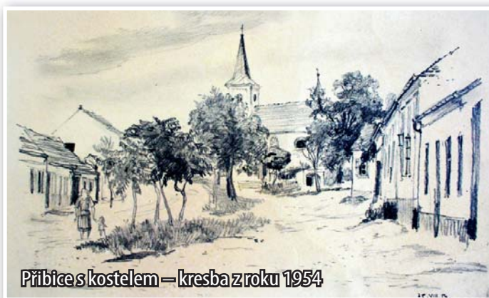
Příbice s kostelem – kresba z roku 1954