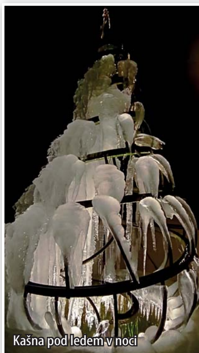
Kašna pod ledem v noci