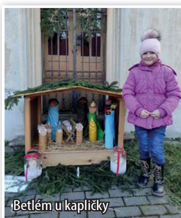
Betlém u kapličky