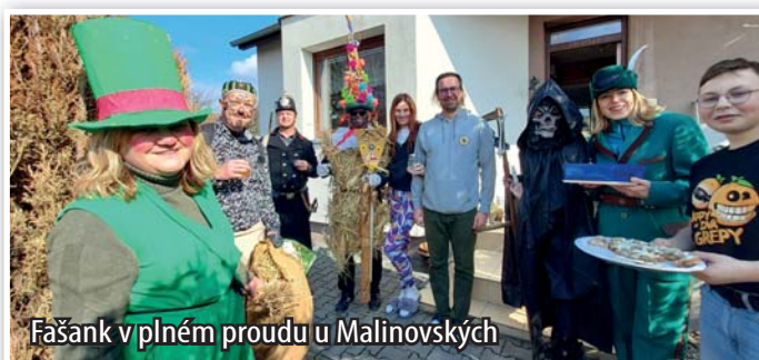
Fašank v plném proudu u Malinových