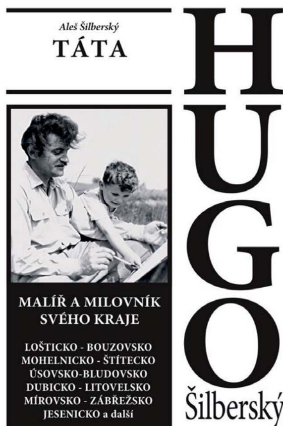
Knihka Táta Hugo Šilberský

Ve svém životě Hugo dosáhl svých největších úspěchů ilustracemi, jako jsou např. Bába a pověsti spisovatele Martina Strouhala v roce 1944 a tvorbou ex libris, které si zahraniční sběratelé u něho objednávali v 50. – 60. letech 20. století. Za ty roky se stal známým evropským umělcem a dodnes se jeho ex libris i obrazy prodávají na internetových burzách. Součástí jeho života byly nespočetné cesty v rodném kraji, po Československu i zahraničí, kde jeho tvorba od moří i z Vysokých Tater vyzářuje pohodou nedělního odpoledne. Několikrát navštívil