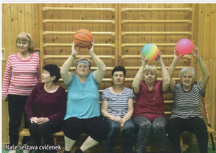
Naše sestava cvičenek