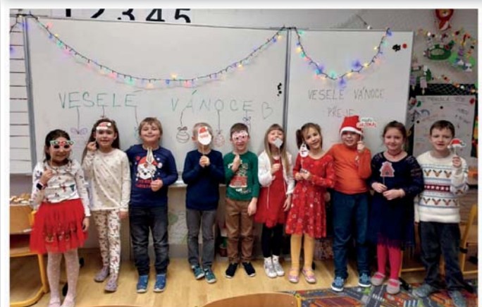
Vánoční den v 1. třídě