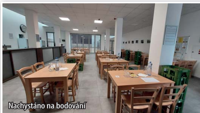
Nachystáno na bodování

V komunitním centru se v neděli 16. března v 10 hodin konalo již tradiční bodování vín. Vinaři z okolních vesnic dodali celkem 333 vzorků, z toho 240 bílých a 93 červených. Hodnotilo celkem 36 hodnotitelů. Výstavní výbor všem vystavovatelům děkuje za jejich vína.