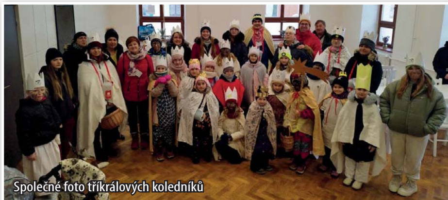
Společné foto tříkrálových koledníků