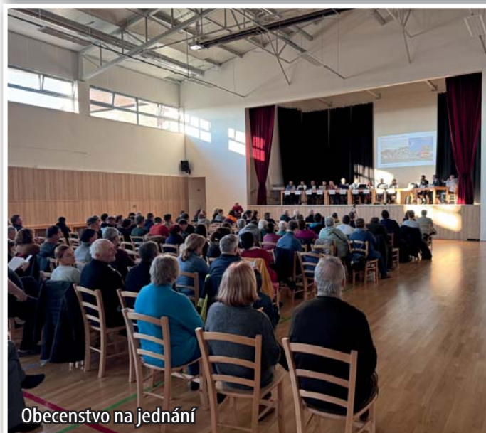
Obecenstvo na jednání