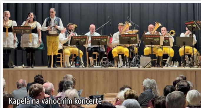
Kapela na vánočním koncertě