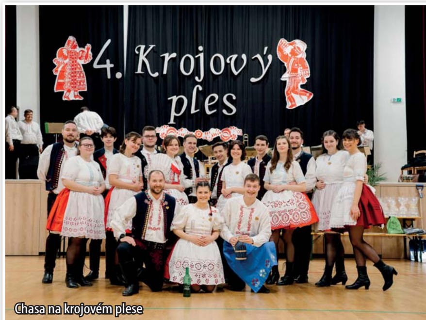
Chasa na krojovém plese