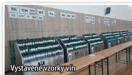
Vystavené vzorky vín