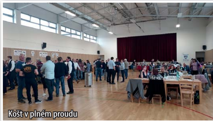
Košť v plném proudu