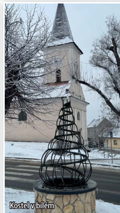
Kostel v bílém