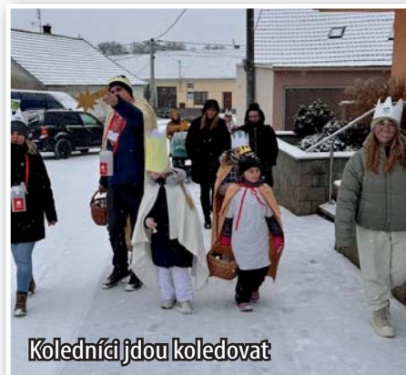
Koledníci jdou koledovat