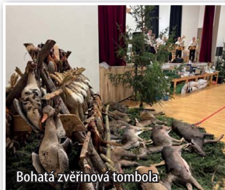
Bohatá zvěřinová tombola