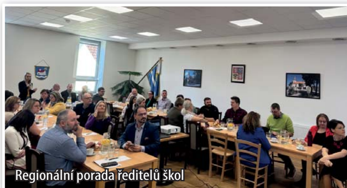
Regionální porada ředitelů škol