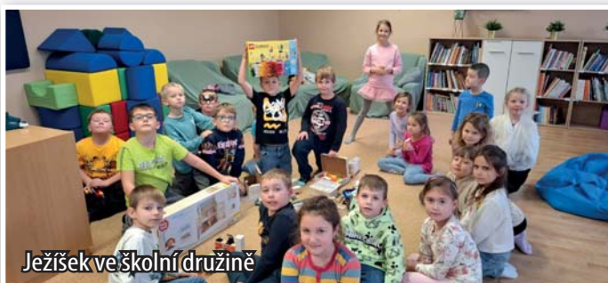
Ježíšek ve školní družině