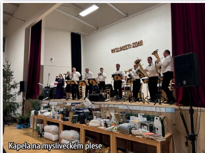
Kapela na mysliveckém plesu