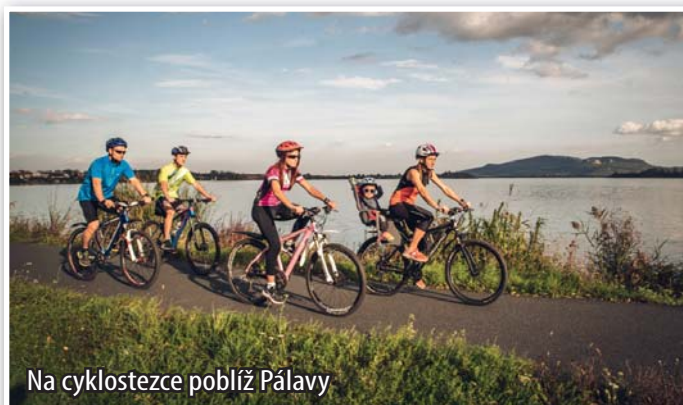
Na cyklostezce poblíž Pálavy