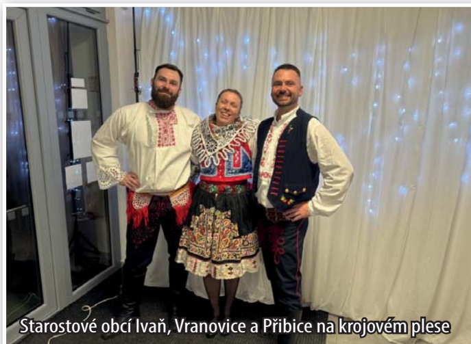
Starostové obcí Ivaň, Vranovice a Přibice na krojovém plese