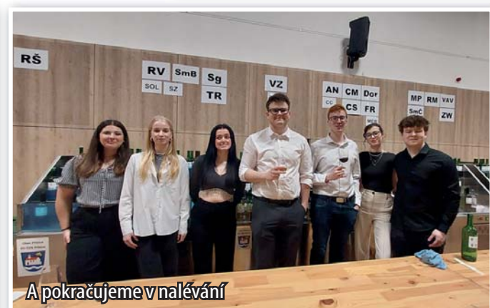
A pokračujeme v nalévání