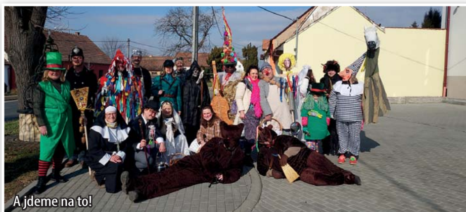
A jdeme na to!

Masopust, lidově nazývaný ostatky nebo fašank, je třítydenní svátek mezi Vánocemi a postní dobou. Zatímco jeho počátek, který nastává po svátku Tří králů (6. ledna), má pevné datum, tak jeho konec na Popeleční středě je závislý na datu Velikonoc a končí v rozmezí od poloviny února do počátku března. Letos skončil v úterý před Popeleční středou, t. j. 4. března.