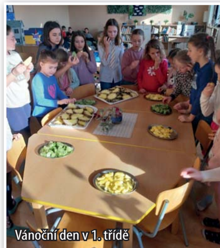
Vánoční den v 1. třídě