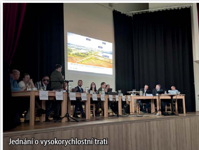
Jednání o vysokorychlostní trati

násep bude vypadat, si velmi dobře uvědomují i zástupci SŽDC, proto ani na opakované výzvy vranovické starostky neodprezentovali pohledové vizualizace. Místo toho, aby se hledalo schůdné řešení pro všechny zúčastněné, hledalo a měnilo SŽDC důvody, proč to upravit nelze. Nakonec sdělili, že je to technicky možné, ale díky tomu, že se nebude na náš katastr navážet tolik zeminy na vytvoření násypů, stavba se dle zástupců SŽDC prodraží. Protože některé argumenty se nám nezdály logické, neustává vedení obce v nesčetných jednáních. S vyhocenou situací byl ze strany obce Přibice, Vranovice a města Rajhrad obeznámen i pan ministr dopravy Kupka, který za tímto účelem navštíví Přibice 29. dubna. Věříme, že se ve vztahu k naší obci situace posune k lepšímu.