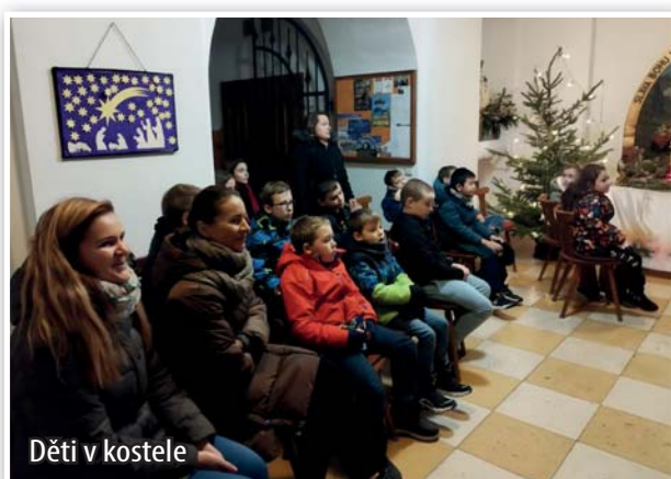
Děti v kostele