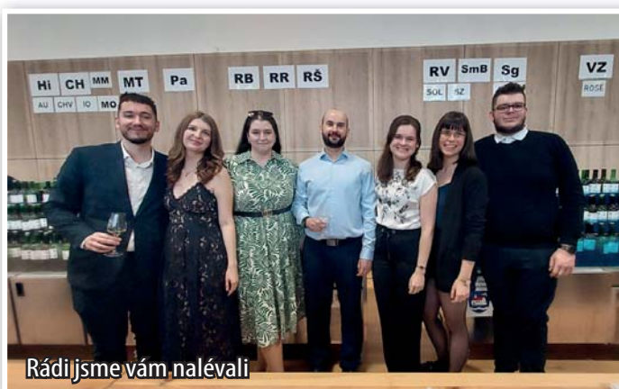
Rádi jsme vám nalévali