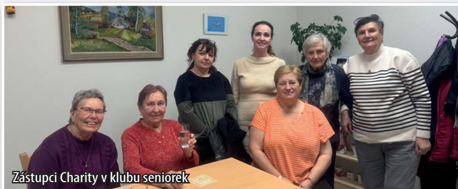
Zástupci Charity v klubu seniorek