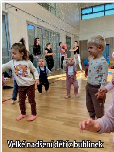
Velké nadšení dětí z bublinek