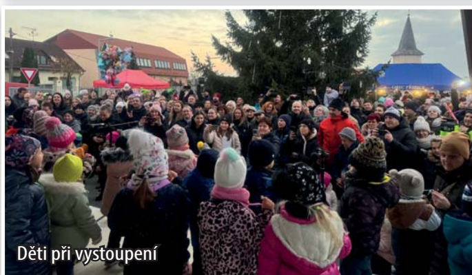
Děti při vystoupení