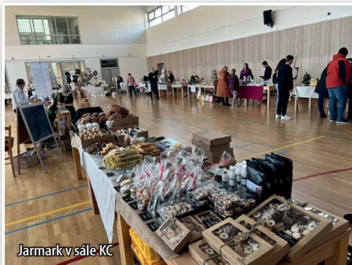
Jarmark v sále KC