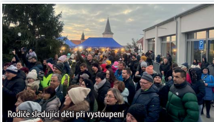
Rodiče sledující děti při vystoupení