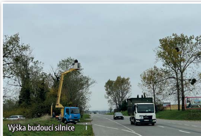
Výška budoucí silnice