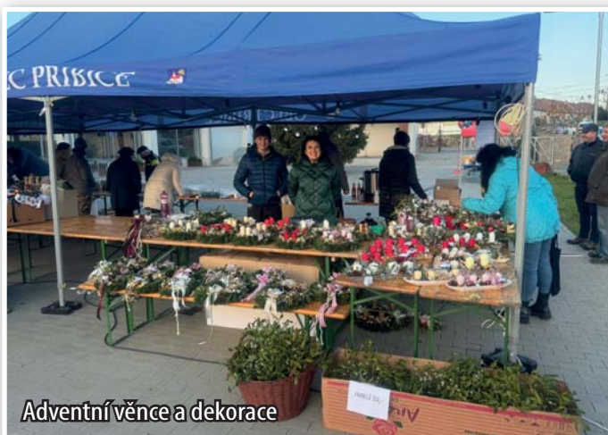
Adventní věnce a dekorace