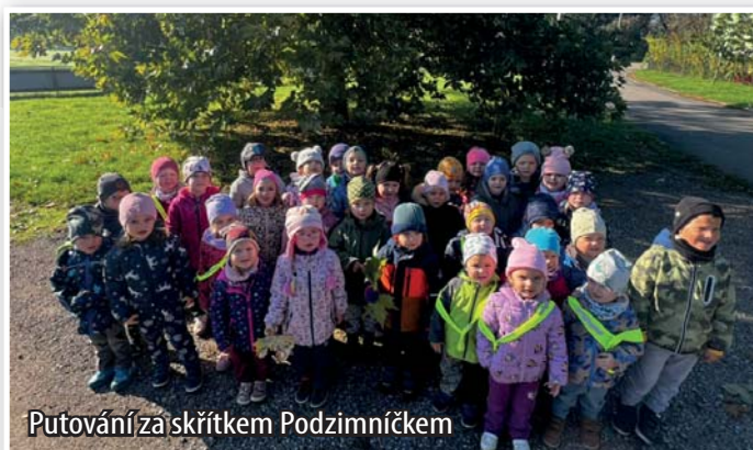
Putování za skřítkem Podzimníčkem