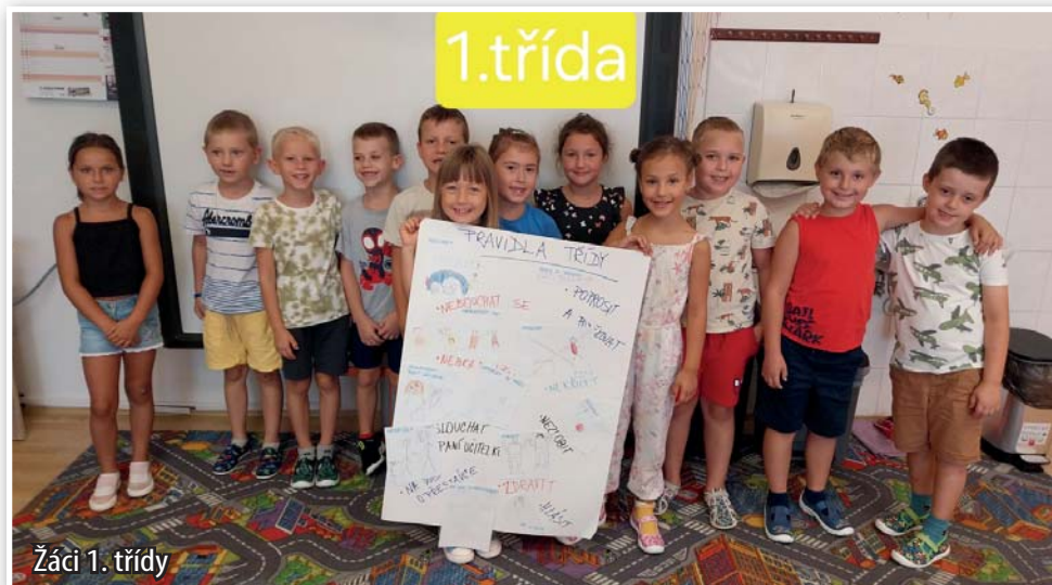
Žáci 1. třídy