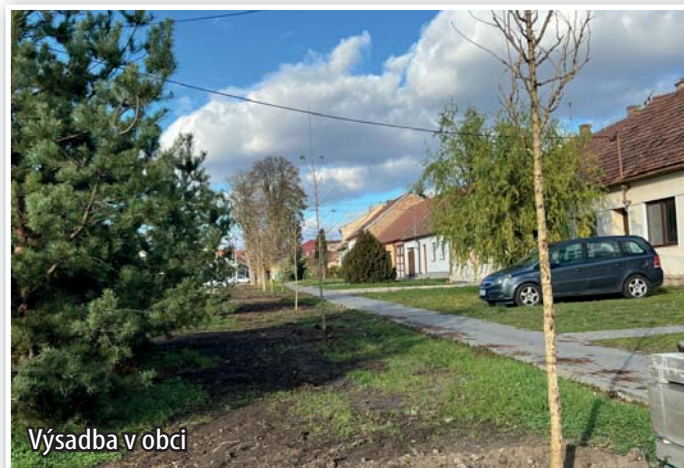
Výsadba v obci