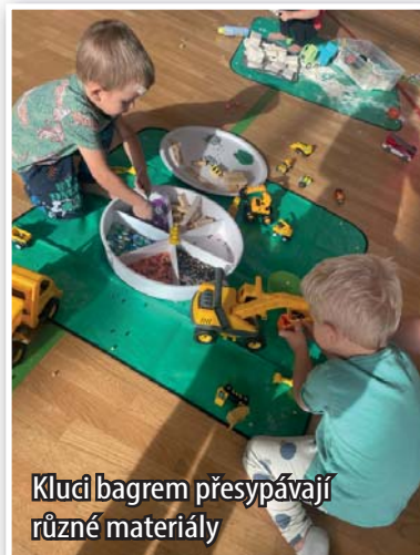
Kluci bagrem přesypávají různé materiály