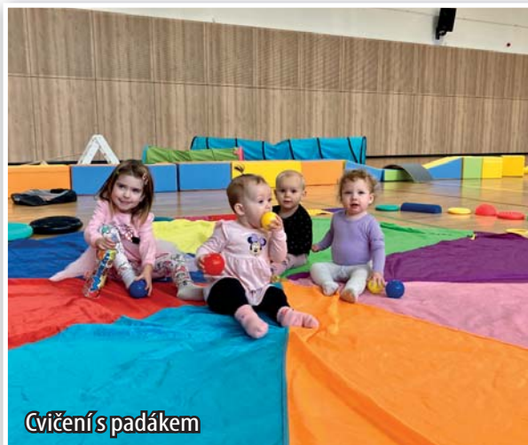
Cvičení s padákem