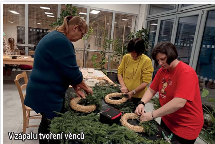
Vzápalu tvoření věnců

Pod vedením zkušené lektorky měli účastníci možnost vytvořit si vlastní originální adventní věnec. Na stolech byly