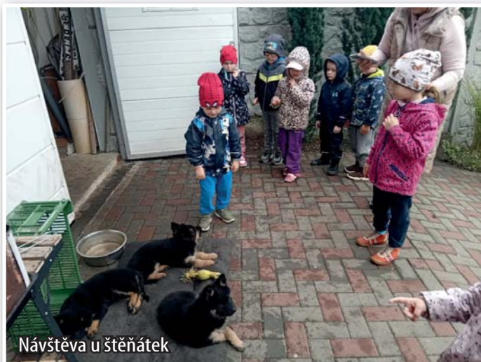
Návštěva u štěňátek