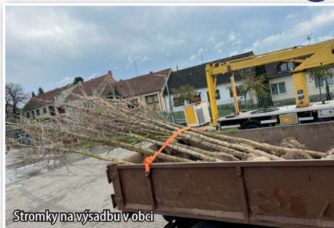
Stromky na výsadbu v obci

Naše obec se nachází v lokalitě, která je stále více ohrožována suchem a větrnou erozí. Obec na své náklady nechala zpracovat hned několik projektů výsadeb na našem katastru. V průběhu října se podařilo vysadit více než deset tisíc stromů a keřů na různých místech. Nové oplocené a vysazené plochy vznikly třeba kolmo na cyklostezku ve směru na Ivaň nebo v lokalitě za bývalým JZD a u pískovny. Vše bylo realizováno ve spolupráci s pozemkovým úřadem a v plné výši hrazeno z dotací.