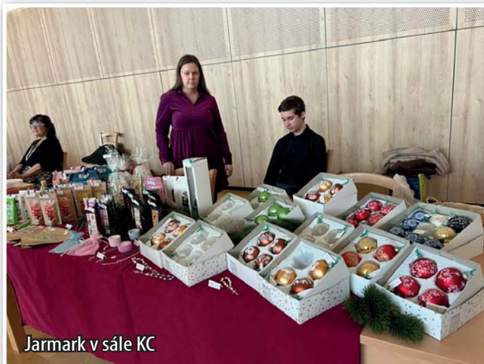
Jarmark v sále KC