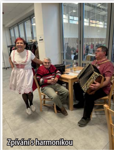
Zpívání s harmonikou