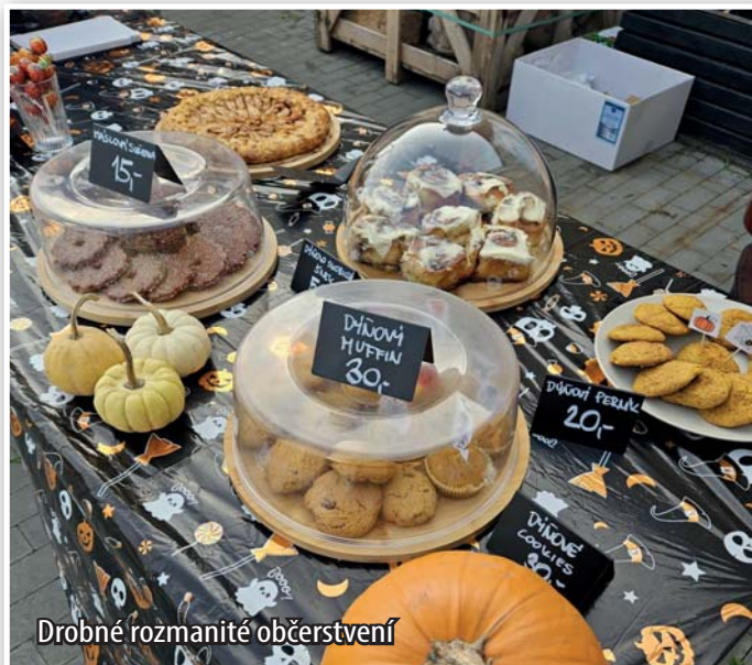
Drobné rozmanité občerstvení