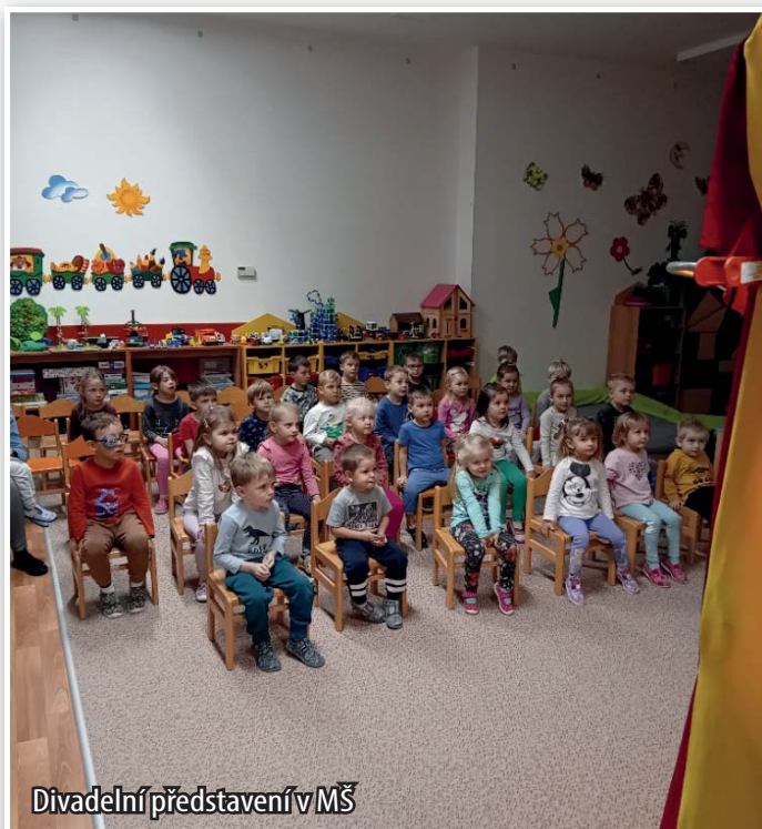
Divadelní představení v MŠ