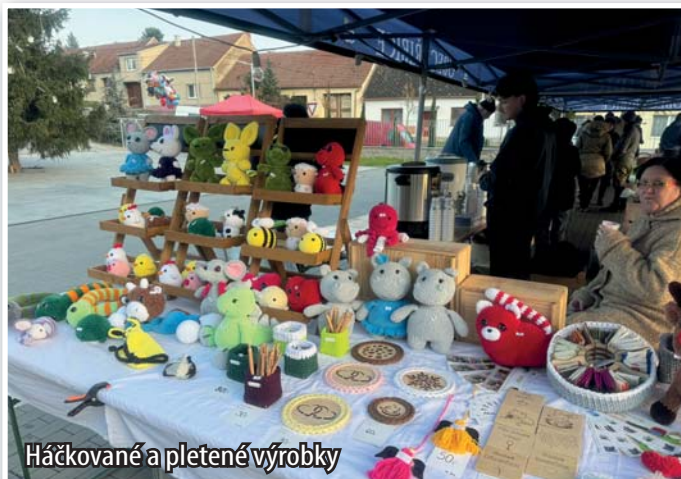
Háčkované a pletené výrobky