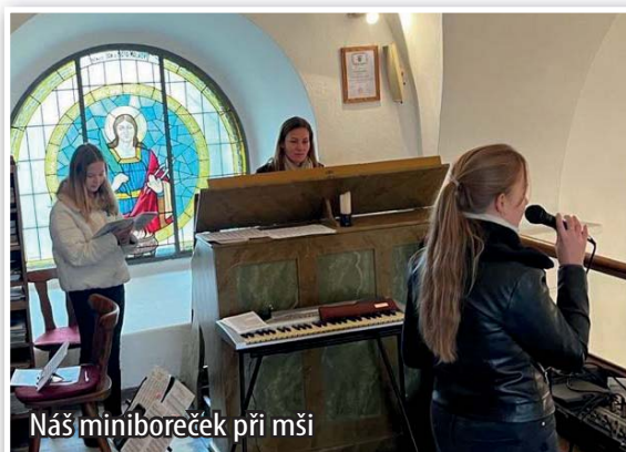
Náš miniboreček při mši