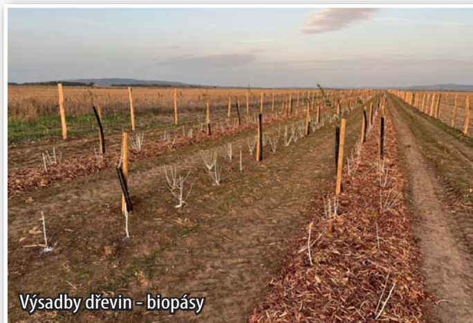
Výsadby dřevin - biopásy