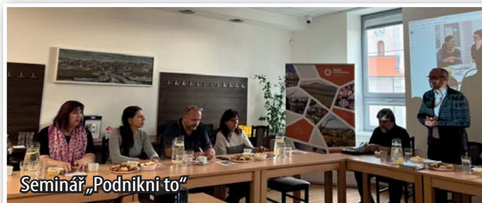
Seminář „Podnikni to“

V úterý 22. října se v Komunitním centru Příbice uskutečnila ve spolupráci s místní akční skupinou akce „Podnikni to“. Jednalo se o seminář zaměřený pro začínající podnikatele. Přednášejícími byli mimo jiné i pracovníci Živnostenského nebo Stavebního úřadu Pohořelice. Právní problematiku osvětlila právnička města Pohořelice.