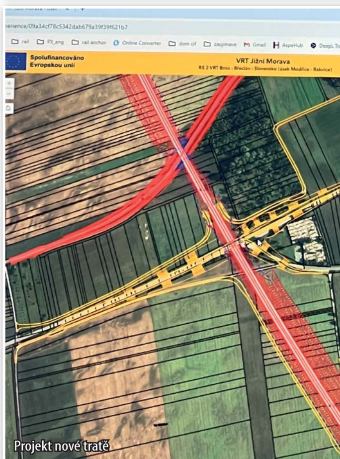
Projekt nové tratě