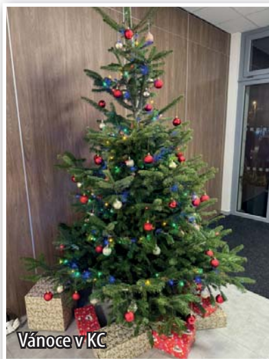
Vánoce v KC

oči. V tento jediný okamžik se souběžně s konáním zastupitelstva v zasedací místnosti cvičilo v posilovně a půjčovaly knihy v knihovně. V hale se odehrával fotbalový trénink, v horním zasedacím prostoru se konala schůze včelařů, ve spolkové části trénovaly příbické zpěvačky, a plno bylo i vedle v klubu senierek.