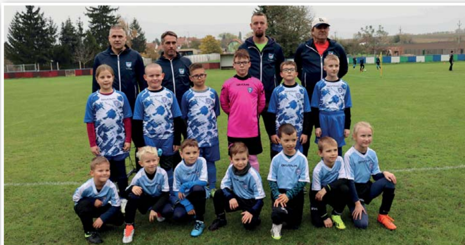
Hráči přípravy a jejich trenéři reprezentující TJ Příbice během podzimní části fotbalové sezóny 2024/2025.