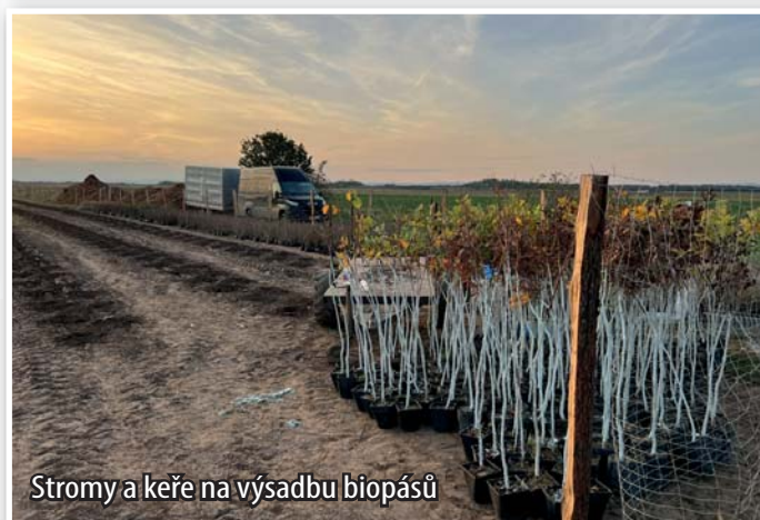
Stromy a keře na výsadbu biopásů