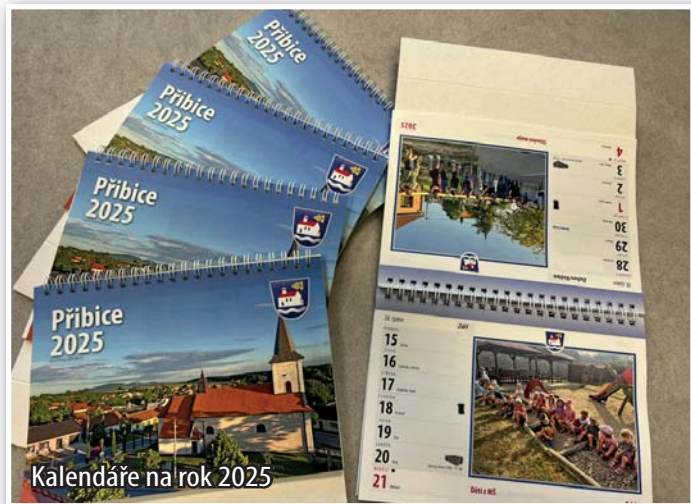
Kalendáře na rok 2025

Obec Přibice opět vydala kalendáře s fotografiemi místních aktivit. V kalendáři najdete stejně jako v předchozích letech jak všechny kulturní akce, tak svozy popelnic či provoz sběrného dvoru. Cena je stejná jako v předchozích letech, tedy 80 Kč, a zakoupit si je můžete na obecním úřadě.