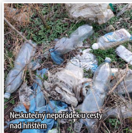
Neskutečný nepořádek u cesty nad hřištěm