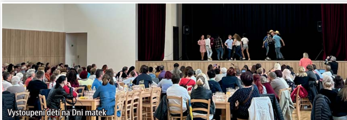
Vystoupení dětí na Dni matek

V neděli 14. května se uskutečnila oslava Dne matek v sále komunitního centra. Děti z místní školy si pod vedením učitelky včetně paní ředitelky a její zástupkyně připravily pěkný program. Vystoupil také dětský folklorní soubor Příbičánek a zazpívali mužáci Příbičané. Atmosféra byla příjemná, všechny maminky a babičky obdržely od pana starosty rudé růže a mezitím mužáci rozlévali přípitek. Celé odpoledne pak hrála cimbálová muzika Šatava.