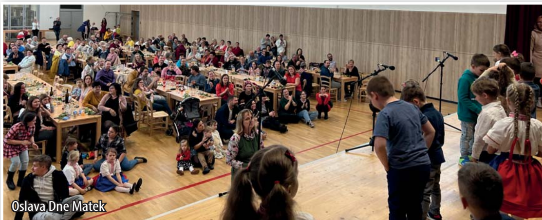
Oslava Dne Mětek