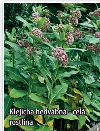
Klejicha hedvábná – celá rostlina