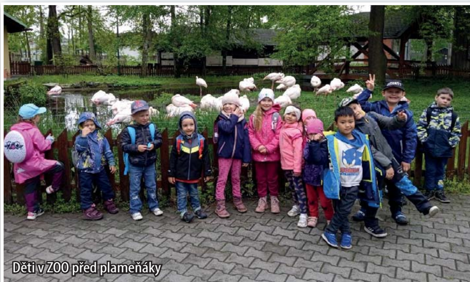
Děti v ZOO před plameňáky