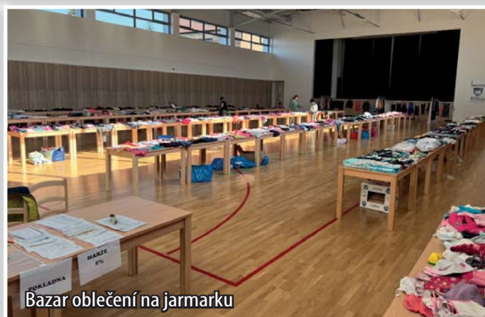
Bazar oblečení na jarmarku