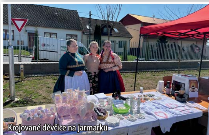
Krojované děvčice na jarmarku