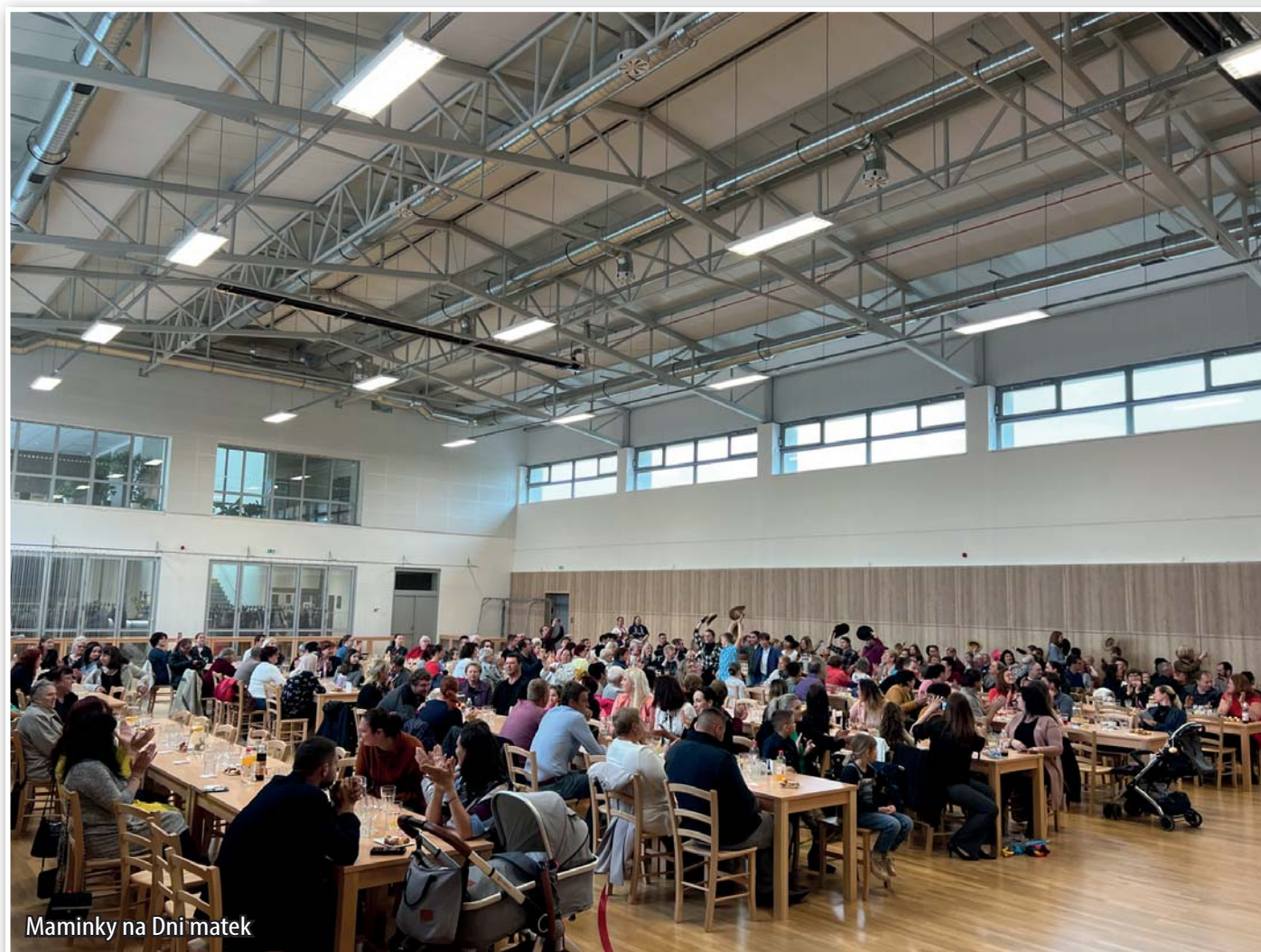
Maminky na Dni matek