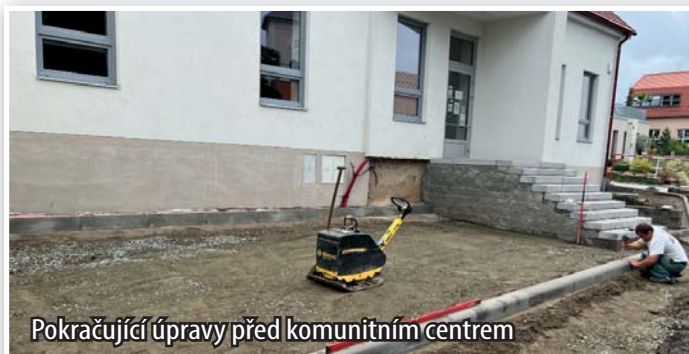
Pokračující úpravy před komunitním centrem