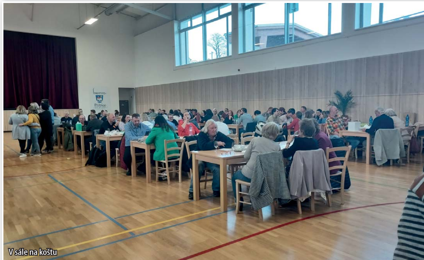
Vsále na koštu