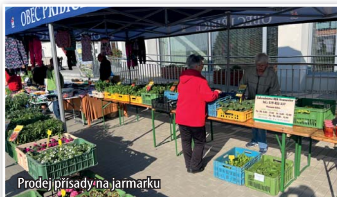
Prodej přísady na jarmarku

ality, mnohé i od krojovaných děvčic a šohajů. Ochutnávka vín se také přišla vhod. Tradičně nechybělo čerstvé pečivo, zákusky, keramika, sazenice různých přísad a okrasných rostlin ve spolupráci s učilištěm Cvrčo-vice a zahradnictvím Rea Vranovice.