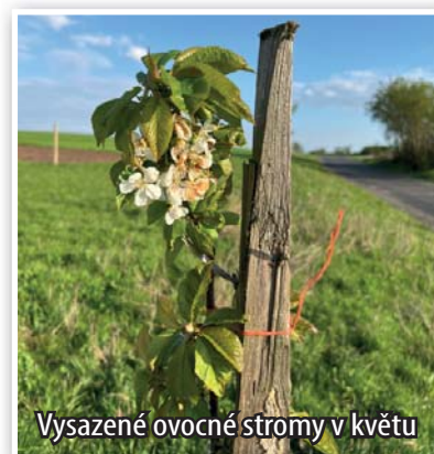
Vysazené ovocné stromy v květu

Ve spolupráci se ZŠ a MŠ Příbice a obcí proběhla dosadba ovocných dřevin podél cyklostezky. Celkem bylo vysazeno 30 stromů, zejména třešně a višně.