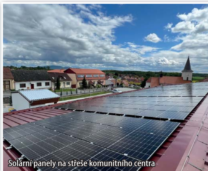
Solární panely na střeše komunitního centra

V průběhu května byly osazeny střechy budov čistírny odpadních vod a komunitního centra fotovoltaickými panely. Naše obec již využívá elektrickou energii získanou ze slunce. Výrobní výkon elektrárny na čističce je 20 kW a veškerá vyrobená energie se zde přímo spotřebuje. A tímto by měla v průběhu sezóny od jara do podzimu pokrýt velkou část spotřeby samotné čističky. Výrobní výkon elektrárny na budově komunitního centra je 50 kW a pokryje 100% spotřeby komunitního centra. Další vyrobená energie bude po propojení kabelem zajišťovat spotřebu na škole a zároveň připravujeme i částečné napojení veřejného osvětlení.