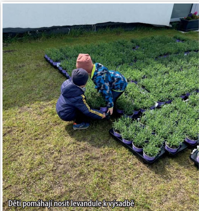
Děti pomáhají nosit levandule k výsadbě