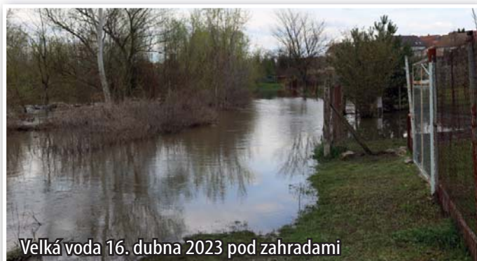
Velká voda 16. dubna 2023 pod zahradami

Letošní jaro se vyskytovaly dešťové srážky více, než jsme byli zvyklí z posledních let, a řeka Jihlava vystoupala až na 2. povodňový stupeň. K žádným škodám ale naštěstí nedošlo.