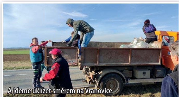
A jdeme uklízet směrem na Vranovice