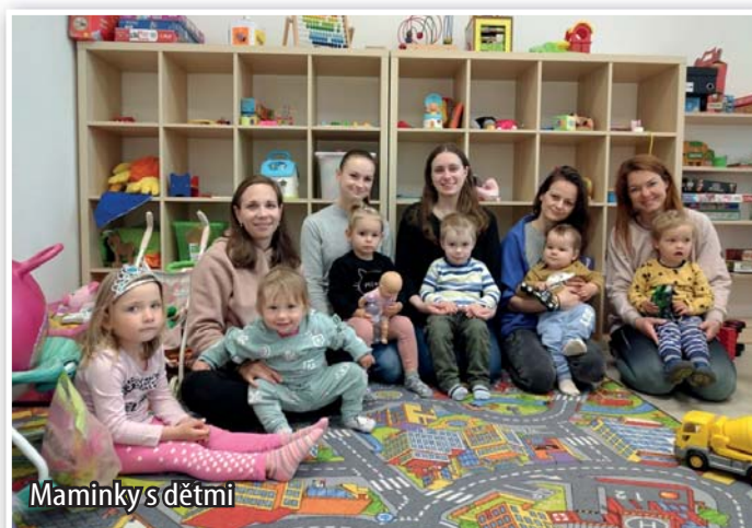
Maminky s dětmi