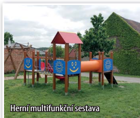
Herní multifunkční sestava