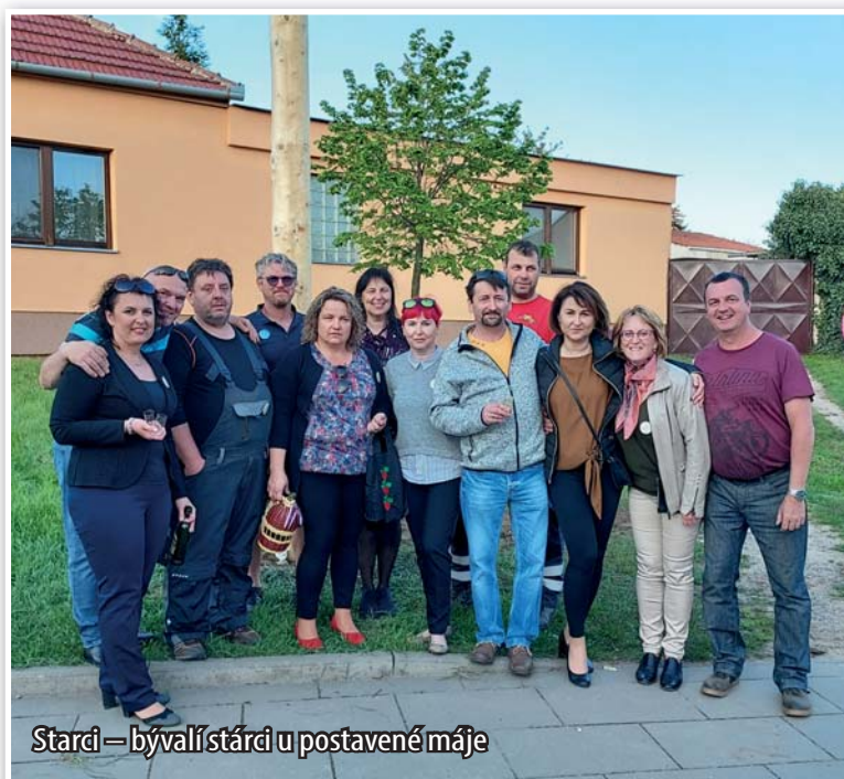
Starci – bývalí stárci u postavené máje