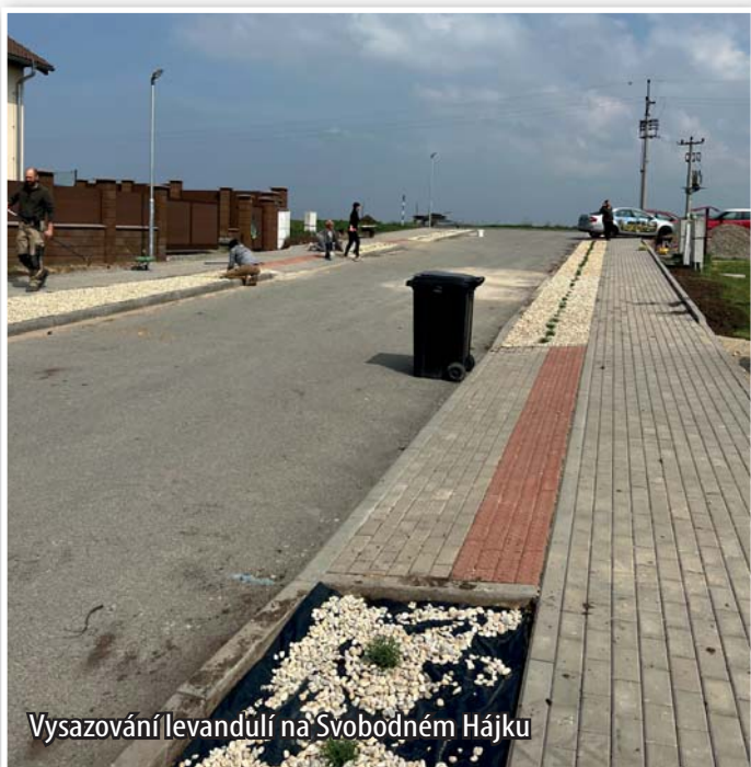
Vysazování levandulí na Svobodném Hájku

Po dokončení chodníků v této lokalitě včetně jeho prodloužení až k Žabiňáku proběhla ve spolupráci obce a obyvatel Svobodného Hájku výsadba 670 keříků levandulí. Lokalita je tak opět hezčí. Dodavatelem rostlin byla firma St. Gabriel.