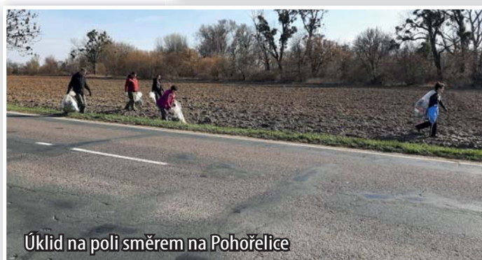
Úklid na poli směrem na Pohořelice