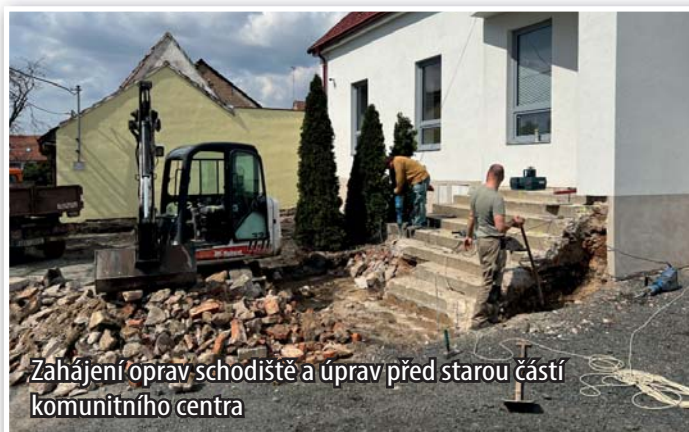
Zahájení oprav schodiště a úprav před starou částí komunitního centra

Obec postupně upravuje prostranství před budovou komunitního centra. Došlo k výměně schodiště ke knihovně a výměně schodiště do sklepa komunitního centra. Část prostranství před budovou bude vydlážděna a vzniknou zde i parkovací místa. Bude zrekonstruována studna a provedena okrasná výsadba.