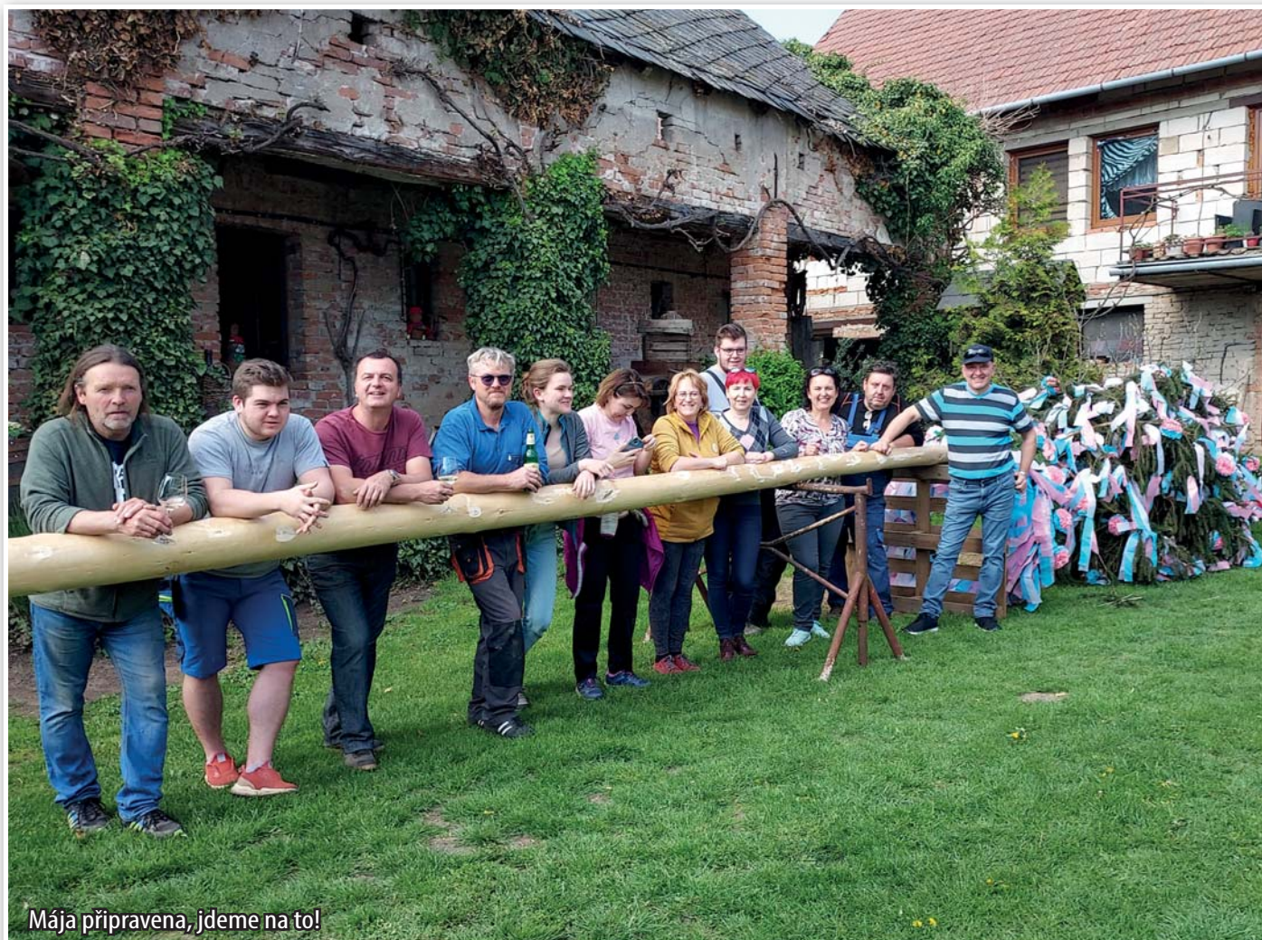
Mája připravena, jdeme na to!