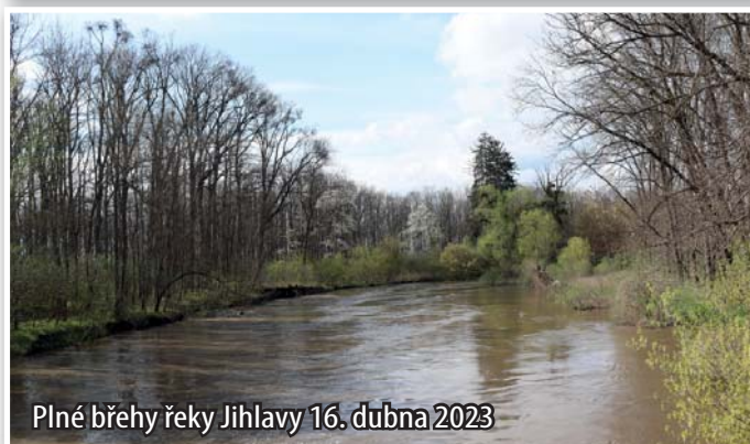
Plné břehy řeky Jihlavy 16. dubna 2023