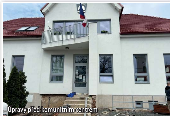
Úpravy před komunitním centrem