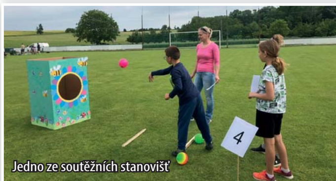
Jedno ze soutěžních stanovišť