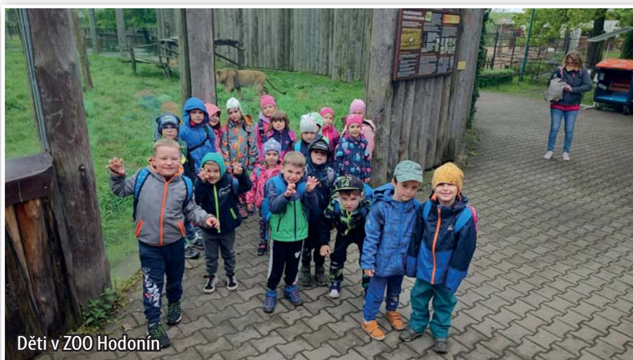
Děti v ZOO Hodonín