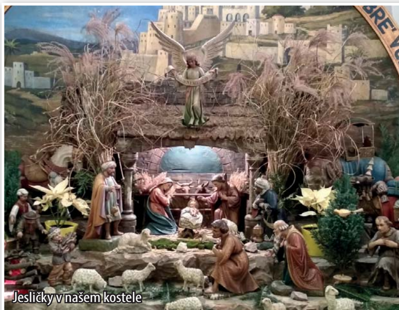
Jesličky v našem kostele