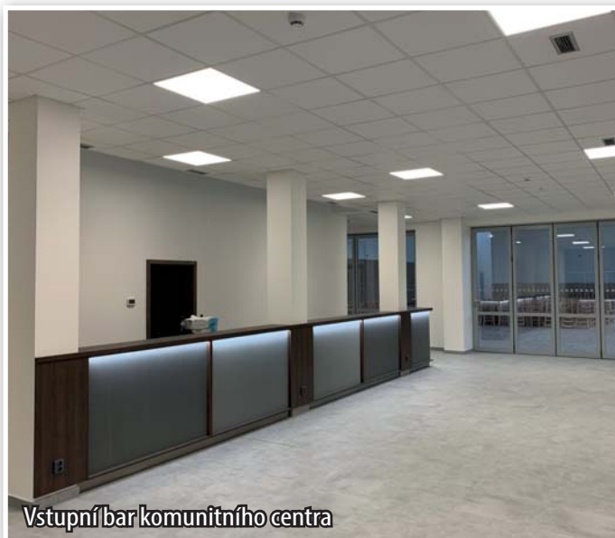
Vstupní bar komunitního centra