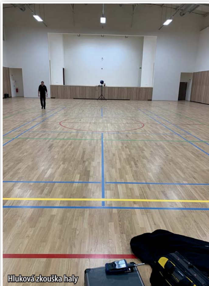
Hluková zkouška haly