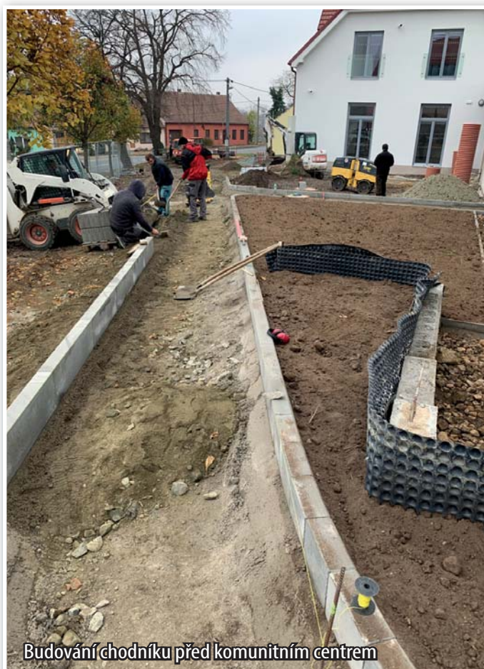
Budování chodníku před komunitním centrem