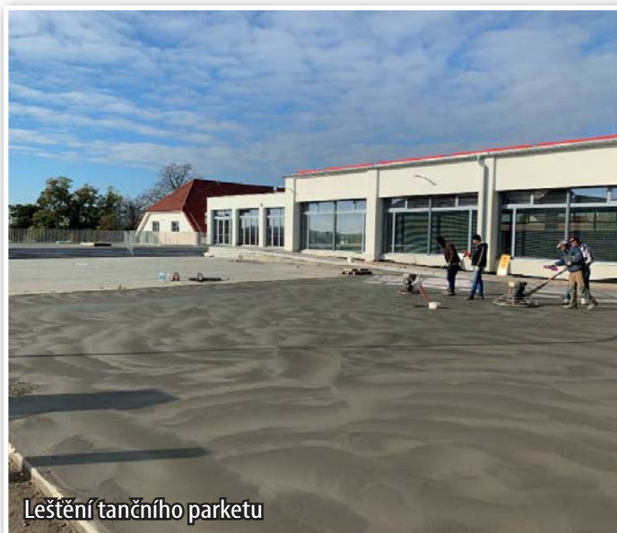
Leštění tančného parketu