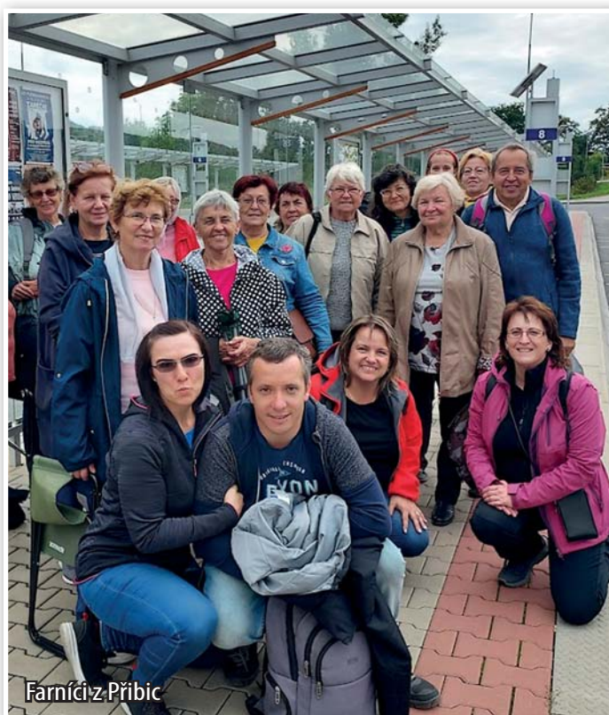
Farníci z Příbice