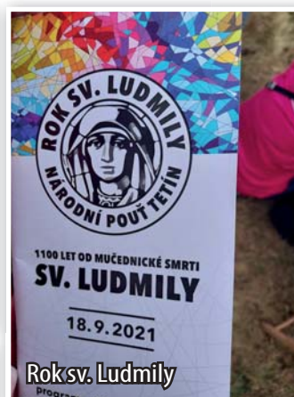
Rok sv. Ludmily