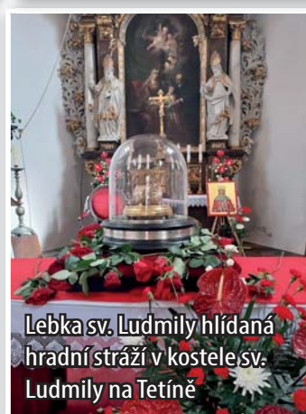
Lebka sv. Ludmily hlídána hradní stráží v kostele sv. Ludmily na Tetině