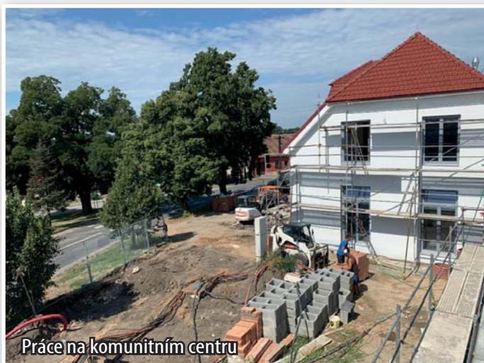
Práce na komunitním centru