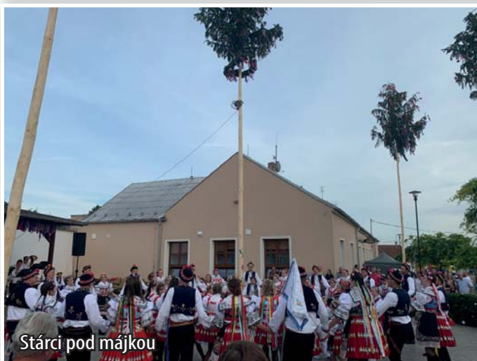
Stárci pod májkou