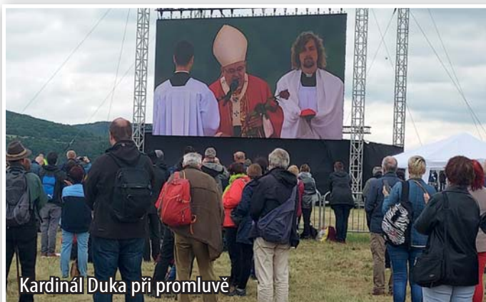
Kardinál Duka při promluvě