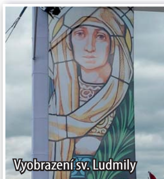
Vyobrazení sv. Ludmily