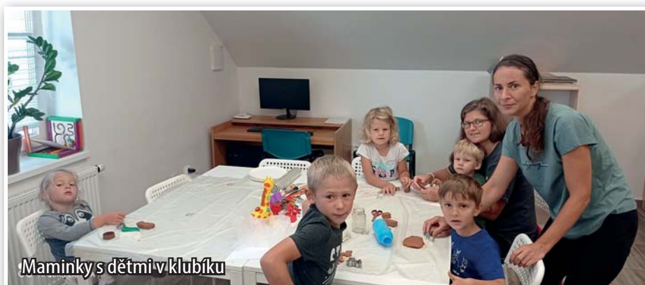
Maminky s dětmi v klubíku