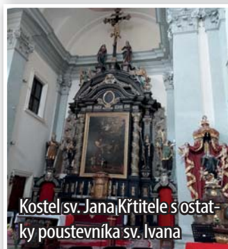
Kostel sv. Jana Křtitele s ostatky poustevníka sv. Ivana