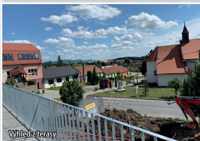
Výhled z terasy