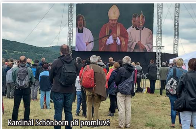
Kardinál Schönborn při promluvě