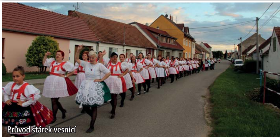
Průvod stárek vesnicí