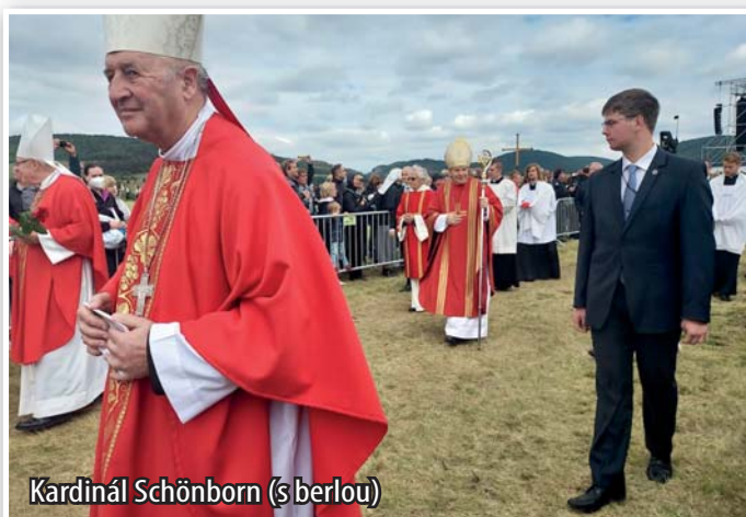
Kardinál Schönborn (s berlou)