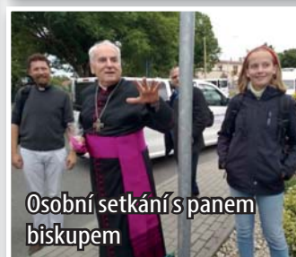
Osobní setkání s panem biskupem