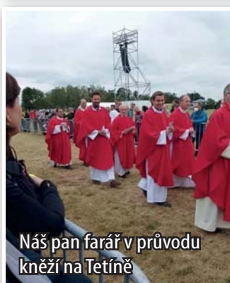
Náš pan farář v průvodu kněží na Tetíně