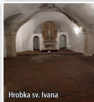
Hrobka sv. Ivana