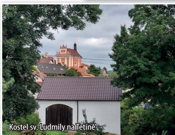
Kostel sv. Ludmily na Tetině