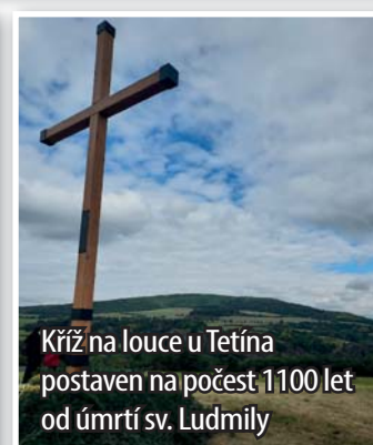
Kříž na louce u Tetína postaven na počest 1100 let od úmrtí sv. Ludmily