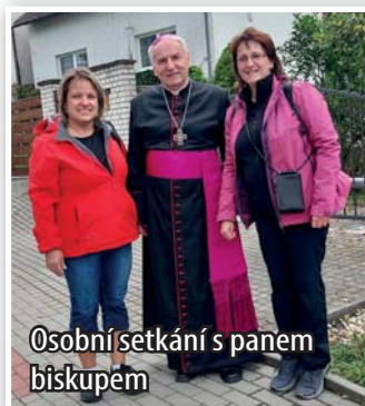
Osobní setkání s panem biskupem