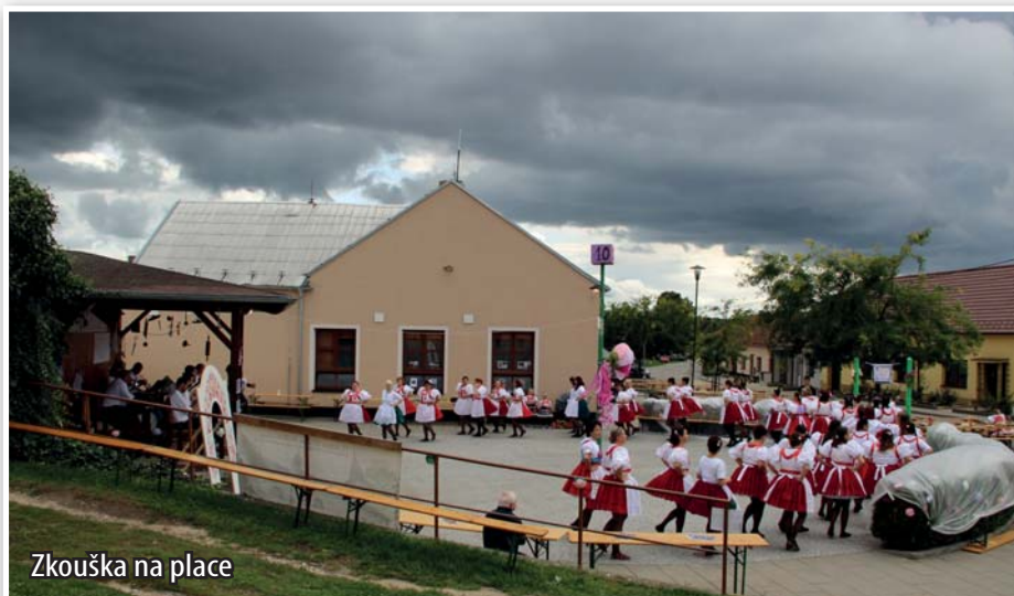
Zkouška na place

Moravskou besedu jsme zvládly na výbornou, proběhlo pivoňkové sólo