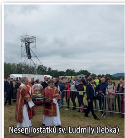
Nesení ostatků sv. Ludmily (lebka)