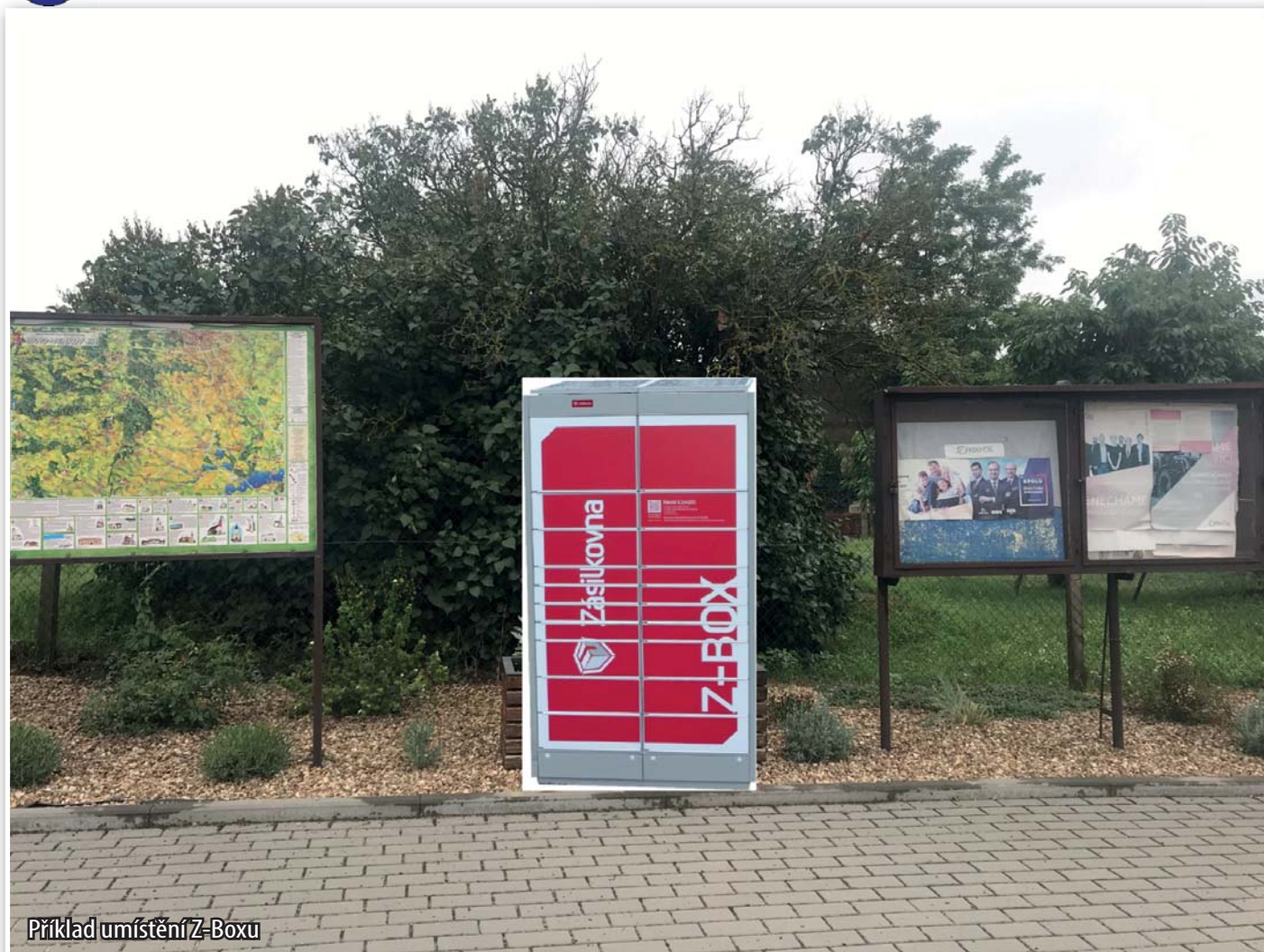
Příklad umístění Z-Boxu