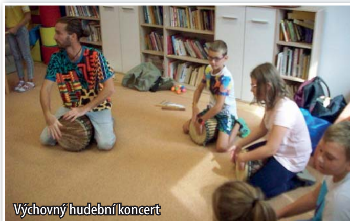
Výchovný hudební koncert