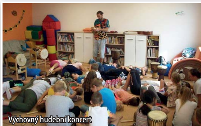
Výchovný hudební koncert