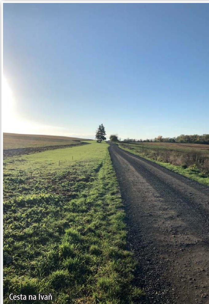
Cesta na Ivaň

kromě pozemky. Cestu jsme nyní po pozemkových úpravách vrátili do původní trasy a její povrch byl zpevněn štěrkem a asfaltovým recyklátem.