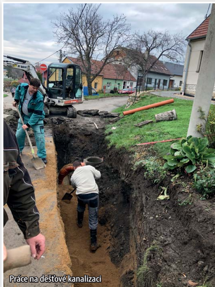
Práce na dešťové kanalizaci

Povedlo se dokončit odvodnění dešťových vod z ulice Těšina do nově vybudované dešťové kanalizace. Tímto krokem se do naší čistírky dostane opět méně vody, kterou je nutno přečerpávat k čištění.