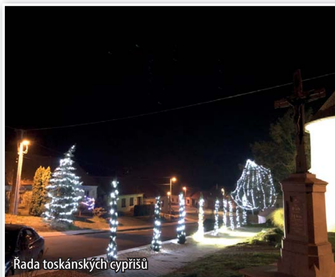
Řada toskánských cypřišů