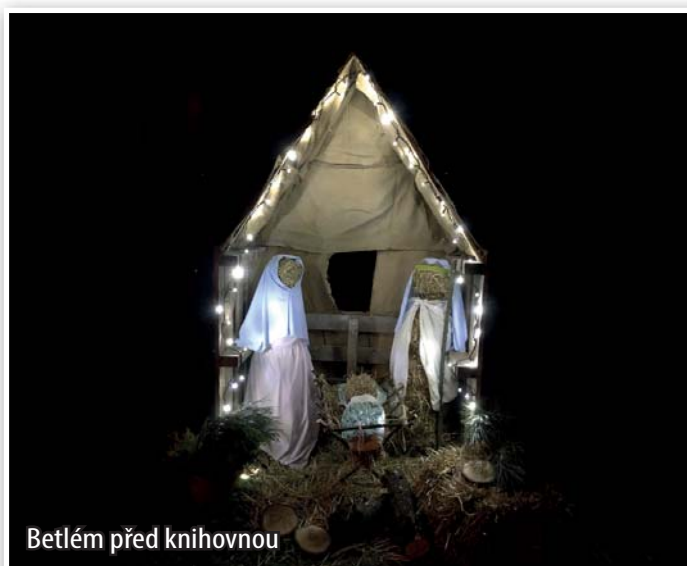
Betlém před knihovnou