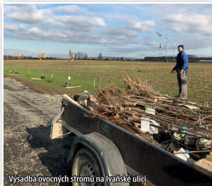
Výsadba ovocných stromů na Ivaňské ulici