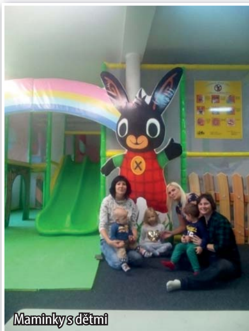
Maminky s dětmi