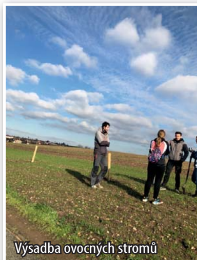
Výsadba ovocných stromů