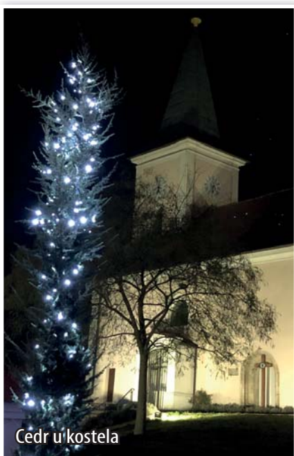
Cedr u kostela