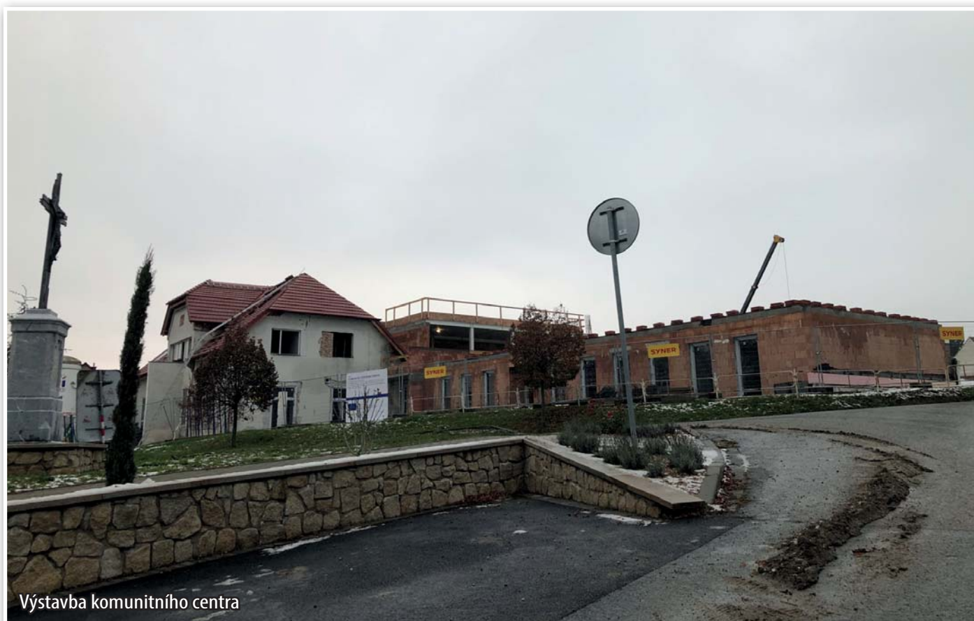
Výstavba komunitního centra