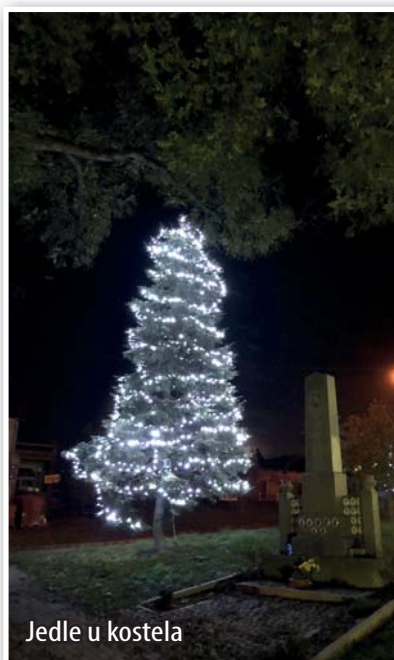
Jedle u kostela