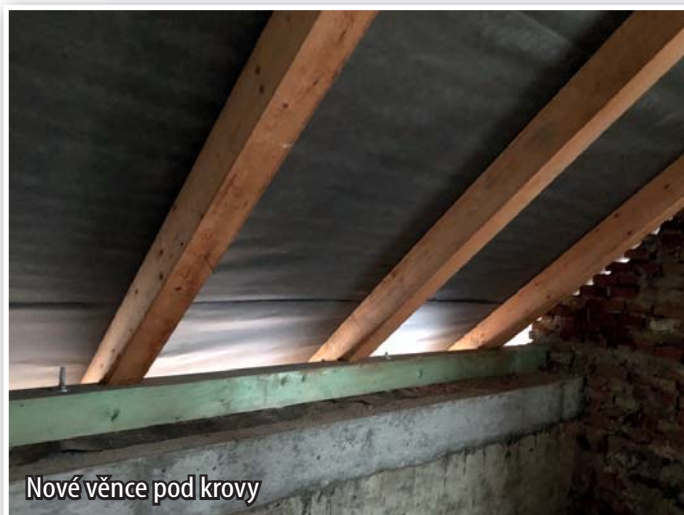
Nové věnce pod krovy