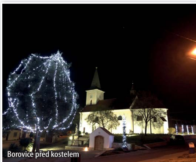
Borovice před kostelem