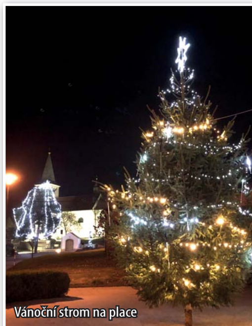
Vánoční strom na place