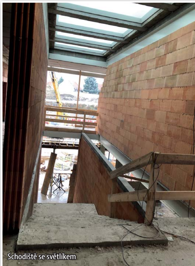
Schodiště se světlíkem