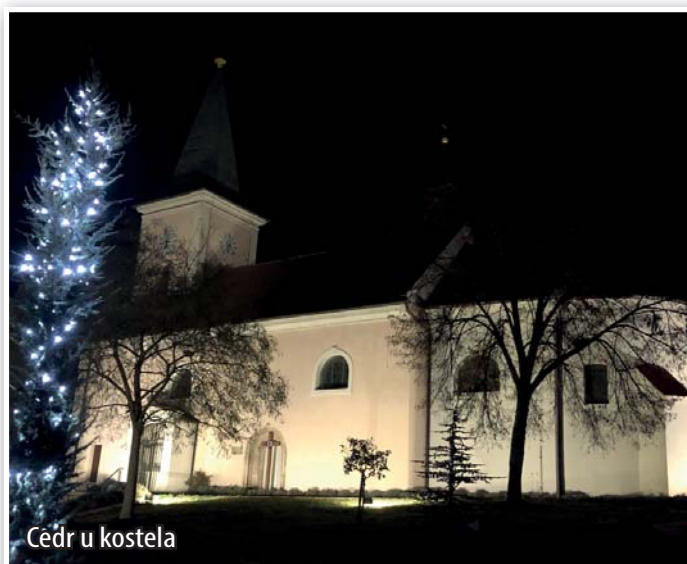
Cédr u kostela