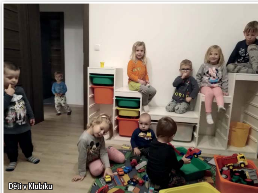
Děti v Klubíku

i třeba o domácnost. Vyzdobily jsme si domov různými dekoracemi, které jsme buď vyrobily my anebo naše ratolesti. Vyrazily jsme si společně i na krásné výlety a užily si plno legrace a dobrodružství. Privítaly jsme na svě-