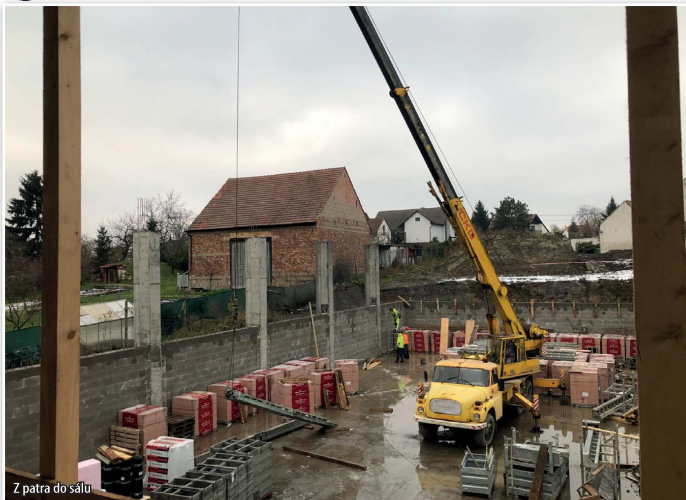
Z patra do sálu