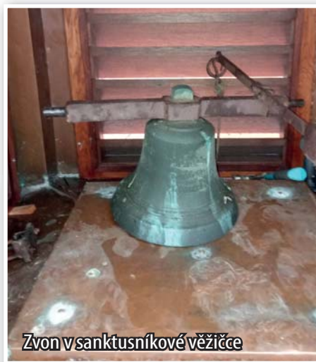
Zvon v sanktusníkové věžičce