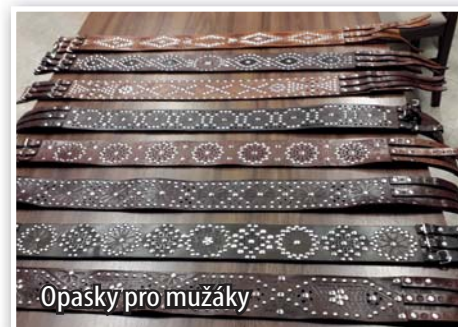
Opasky pro mužáky

Přebické mužáky napříště uvidíte již s novými krojovými kalhotami a koženými opasky, které mají díky dotaci od Jihomoravského kraje ve výši 50.000 Kč.