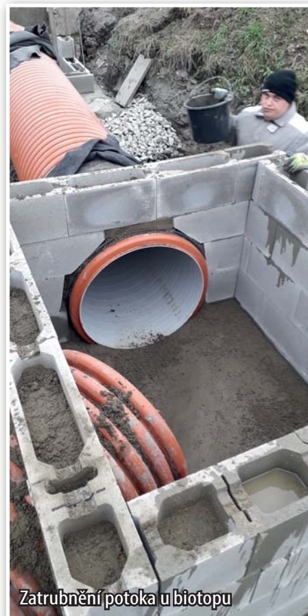
Zatrubnění potoka u biotopu