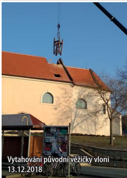
Vytahování původní věžičky vloni 13.12.2018