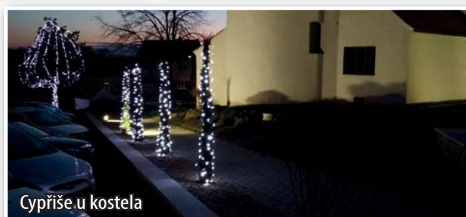
Cypřiše u kostela