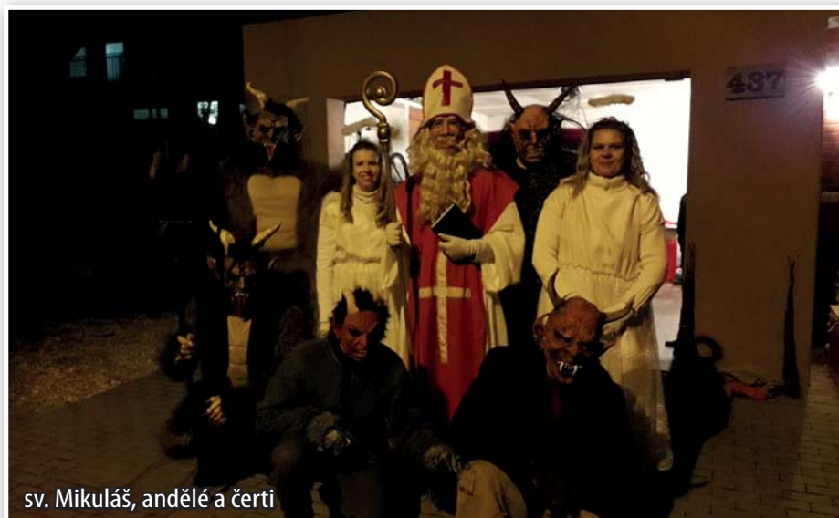
sv. Mikuláš, andělé a čerti

Již tradičně našimi ulicemi procházel sv. Mikuláš s anděly a bandou čertů. Hodným dětem přinášel nadílku.