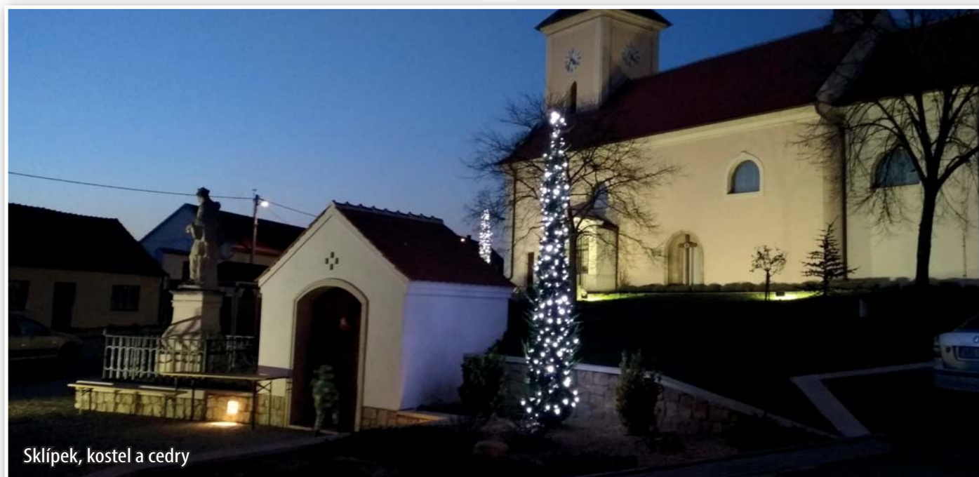
Sklípek, kostel a cedry