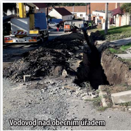
Vodovod nad obecním úřadem

Ve spolupráci s VaK Břeclav se podařilo vyměnit problematický úsek vodovodu od obecního úřadu ke škole za nový. Výkopové práce obec provedla svépomocí a dodávku materiálu a montáž potrubí provedla společnost VaK. Do budoucna se tak ušetří voda, která v těchto místech při poruchách unikala.