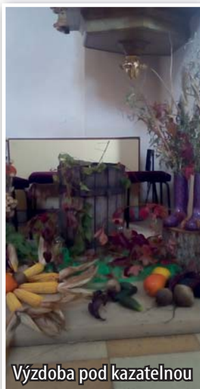
Výzdoba pod kazatelnou