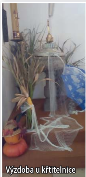
Výzdoba u křtítnice