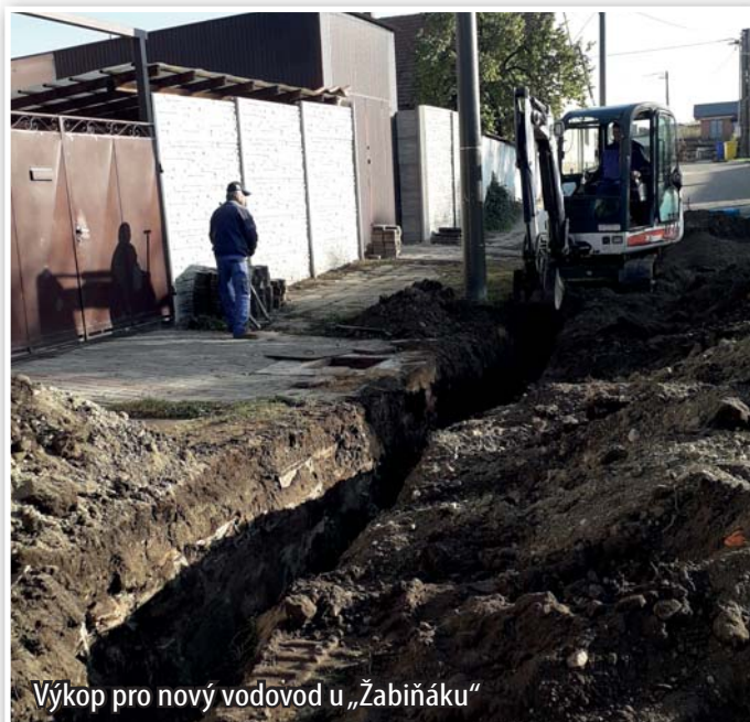
Výkop pro nový vodovod u „Žabiňáku“