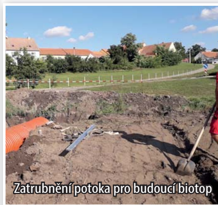
Zatrubnění potoka pro budoucí biotop

Pomaličku probíhají průběžně práce na ohrázení lokality na budoucí biotop na Lůži. Nyní je na řadě odvedení a zatrubnění části potoka, který pramení ve Žlíbkách.