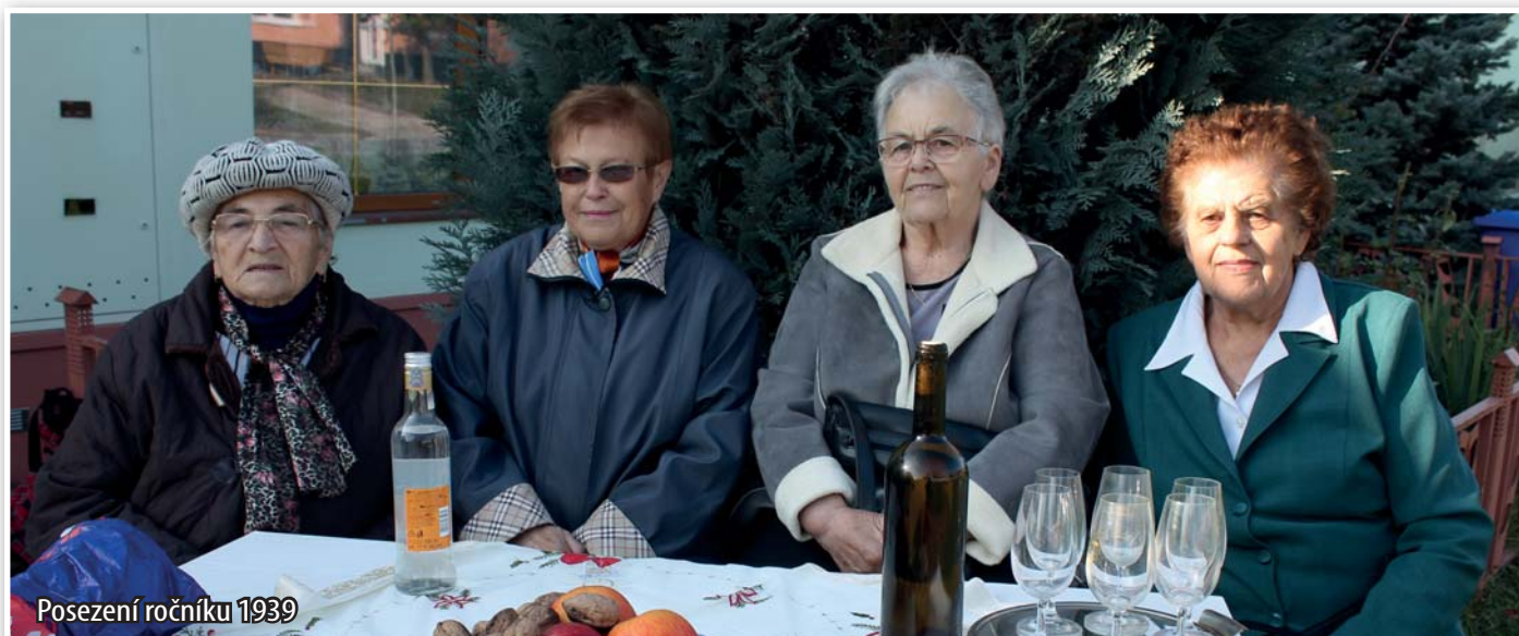
Posezení ročníku 1939

Pravidelně se setkávají vrstevníci z ročníku 1939. Snímek zachycuje jejich přátelské posezení.