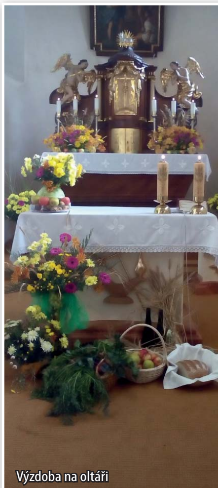
Výzdoba na oltáři