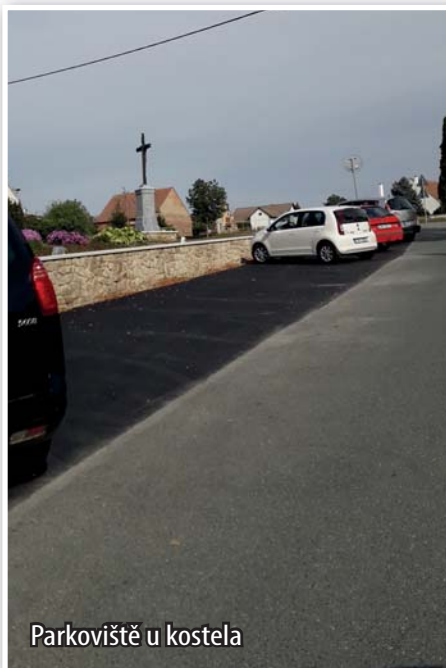
Parkoviště u kostela

Postupně plníme požadavky občanů i stavebního úřadu na rozšíření parkovacích míst v centru obce. Tentokrát se dokončilo parkoviště u kostela. Poslední fáze – asfaltový povrch byl položen na podzim a již slouží svému účelu. Rozšířené parkování tak ocení zejména rodiče dětí při návštěvě školy.