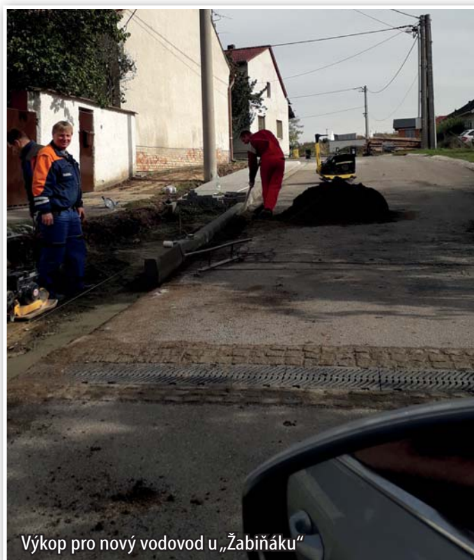
Výkop pro nový vodovod u „Žabiňáku“