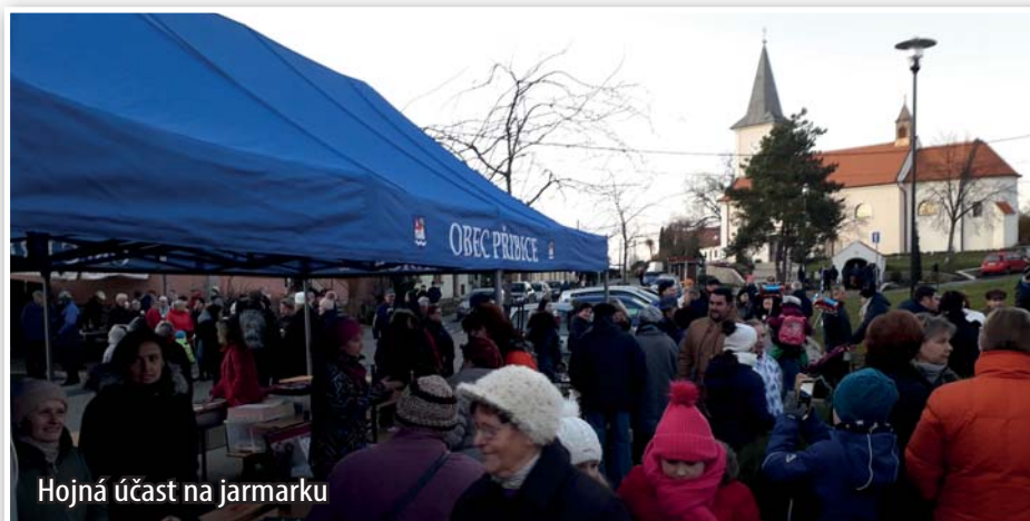
Hojná účast na jarmarku