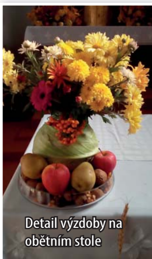
Detail výzdoby na obětním stole