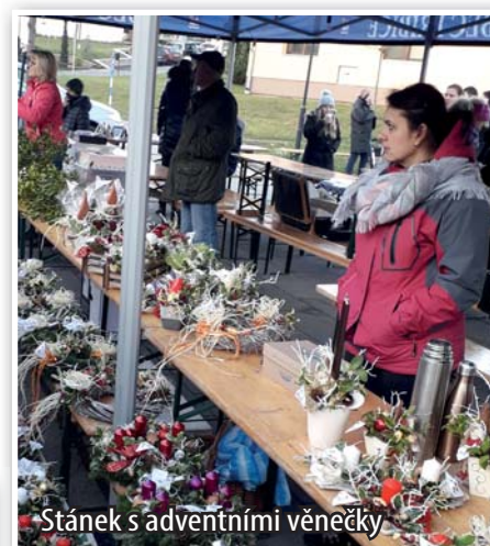
Stánek s adventními věnečky

kalendáře apod. a ochutnat výborný svařák. Děti z MŠ a ZŠ měly připravené pásmo říkanek a písniček. Vánoční strom se rozsvítil, až děti třikrát zvolaly: „Stromečku, rozsviť se!“ Také byl otevřený obecní sklípek, kde se mohlo ochutnat a zakoupit dobré víno z Vinařství Koubek Příbice.