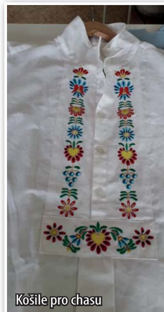
Košile pro chasu