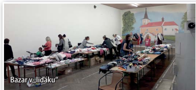
Bazar v „lidáku“

Na podzim se konaly v „lidáku“ dva bazary oblečení, akce se opakovala díky předchozímu úspěchu. Nového majitele tak našlo spoustu oblečení.