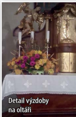
Detail výzdoby na oltáři