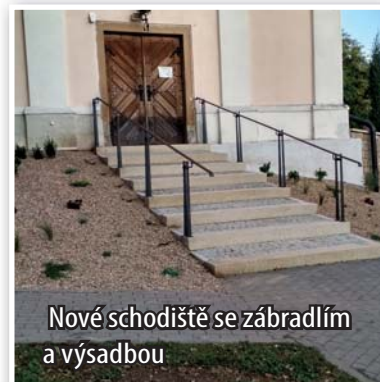
Nové schodiště se zábradlím a výsadbou

Obecní zaměstnanci provedli opravu západního schodiště do kostela. Jako materiál byly použity schodnice vyřezané z mrákotínské žuly. Opravy byly prováděny díky dotaci od Jihomoravského kraje.