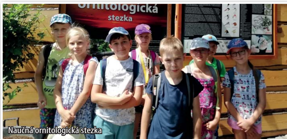
Naučná ornitologická stezka