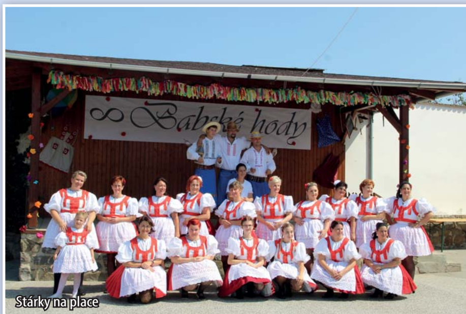
Stárky na place