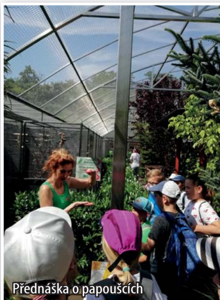
Přednáška o papoušcích