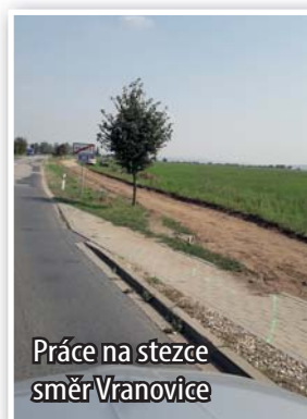
Práce na stezce směř Vranovice

V současné době provádí obecní zaměstnanci práce na podkladu nové cyklostezky od posledního domu v Přibicích směrem na Vranovice. Trasa cyklostezky čekala na dokončení pozemkových úprav. V polovině října se již dostanete po novém asfaltovém povrchu bezpečně z Přibic až do Vranovic.