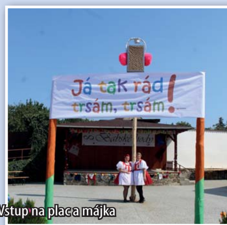
Vstup na place májka