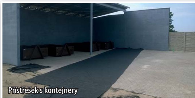
Přístřešek s kontejnery