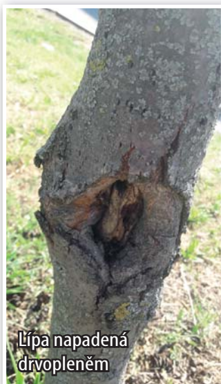
Lípa napadená drvopleněm

Díky dotaci od Jihomoravského kraje budeme moci vysadit více stromů v naší obci. Budeme rádi za tipy, kam by se stromy mohly vysadit. Bude-li to možné, vysadíme stromy na všechna navržená místa. Výsadby nemůžeme provádět v ochranných pásmech inženýrských sítí a na neveřejné pozemky. Společná výsadba proběhne na podzim ve spolupráci se žáky ZŠ a MŠ, s dobrovolníky a bude předem vyhlášena.