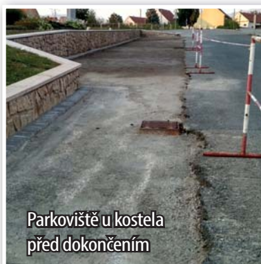
Parkoviště u kostela před dokončením

Parkoviště u kostela je těsně před dokončením. Kapacita se zvýší na dvojnásobek. Asfaltový povrch by měl být hotový již brzy. Okolí se ještě upraví a na podzim se provede výsadba zeleně.