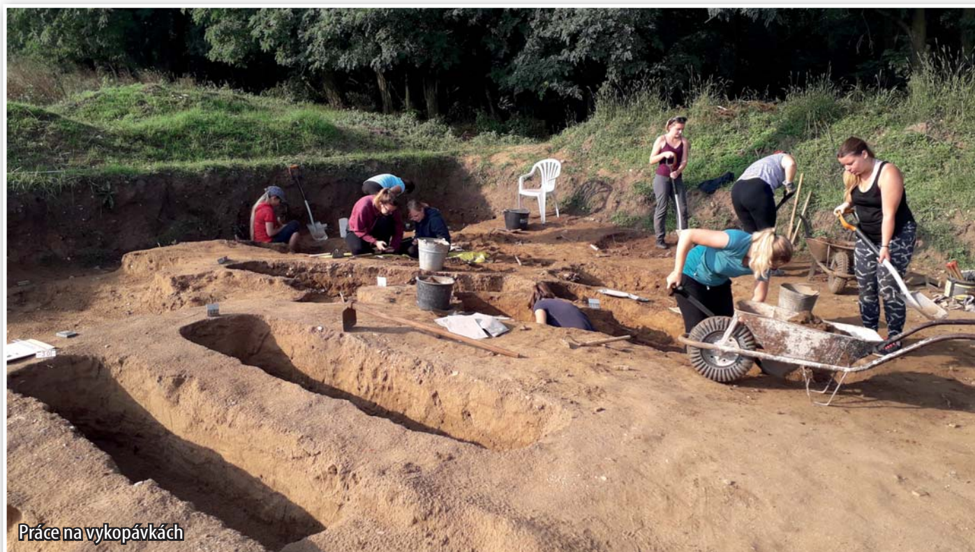
Práce na vykopávkách