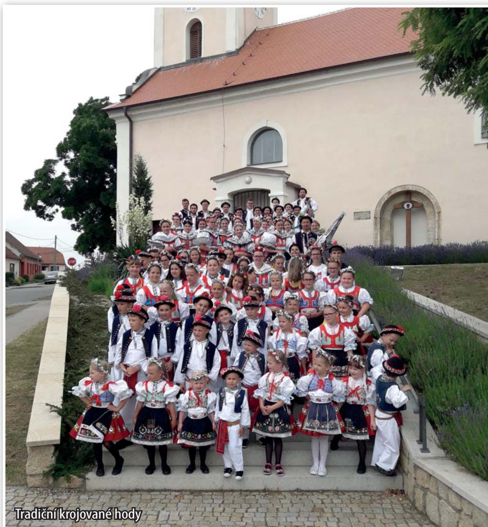
Tradiční krojované hody