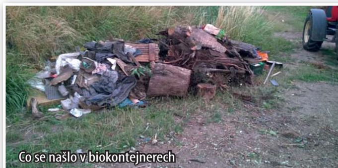
Co se našlo v biokontejnerech

ma. Druhý způsob bude do biopopelnic, které vám vydá obec rovněž zdarma. Svoz popelnic bude probíhat podle svozového kalendáře. Třetím způsobem je odvoz na sběrný dvůr. Tímto způsobem oddálíme navyšování poplatků za odvoz odpadů v naší obci.