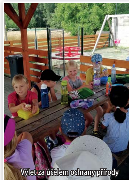
Výlet za účelem ochrany přírody