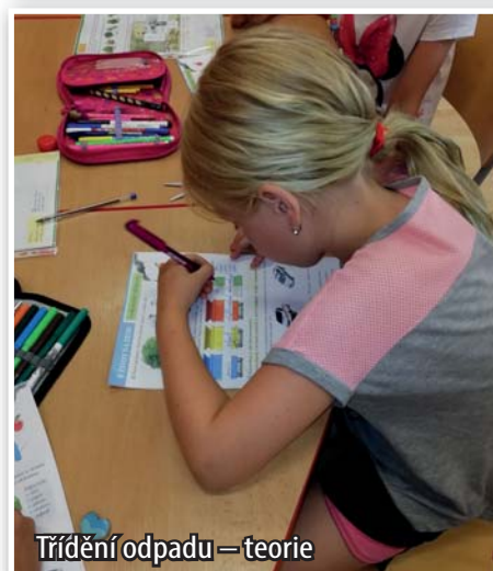
Třídění odpadu – teorie