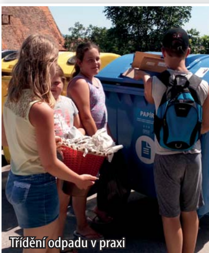
Třídění odpadu v praxi