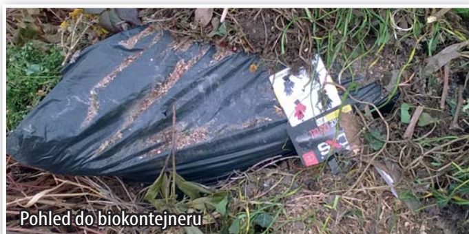
Pohled do biokontejneru