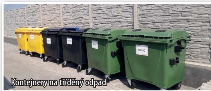
Kontejnery na tříděný odpad