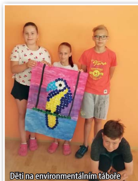
Děti na environmentálním táboře