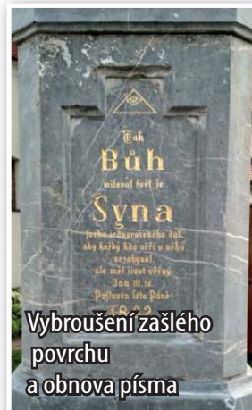
Vybroušení zašlého povrchu a obnova písma