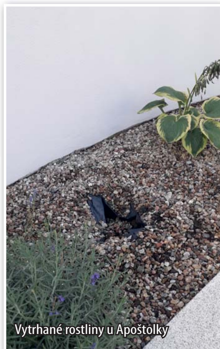
Vytrhané rostliny u Apoštolky