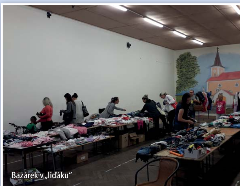
Bazárek v „lidáku“