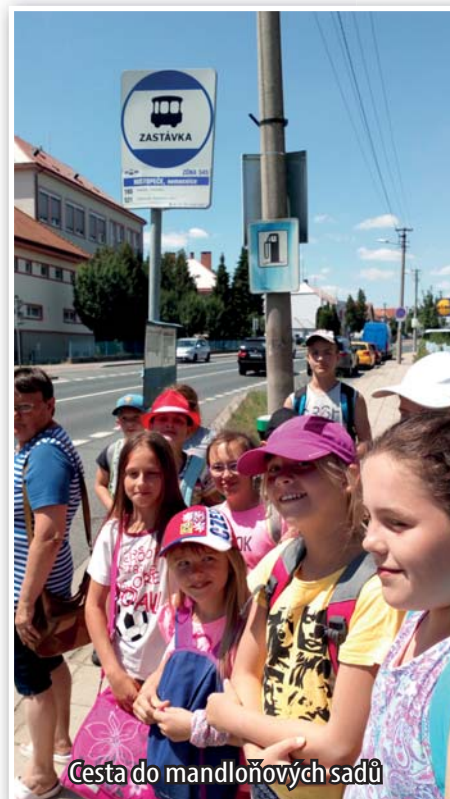
Cesta do mandloňových sadů

Velké díky bych vyslovila všem učitelkám a zaměstnancům za ochotu a pěkný přístup k dětem, poděkovala jim za jejich nápady, vstřícnost a obětavost. Všechny akce, které pořádáme, je nejenom třeba uvážlivě naplánovat, promyslet, uskutečnit, ale je zapotřebí vynaložit spoustu volného času, za toto vše nejenom jim, ale i jejich rodinám velmi děkuji.