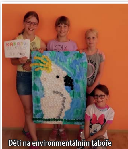
Děti na environmentálním táboře