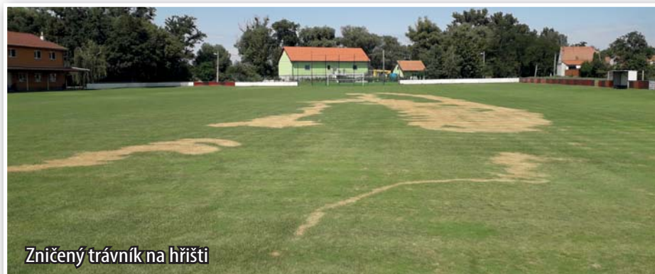
Zničený trávník na hřišti

lepší využití svého času nebo se jen potřeboval pomstít našim sportovcům? Vše se přece dá řešit i jinak, než poškozovat veřejný majetek. Jiný jedinec si zase asi potřeboval zkrášlit svou zahrádku na úkor nás všech. V tomto případě vytrhl třeba červenolistý buk u Apoštolky. Kam to spějeme?