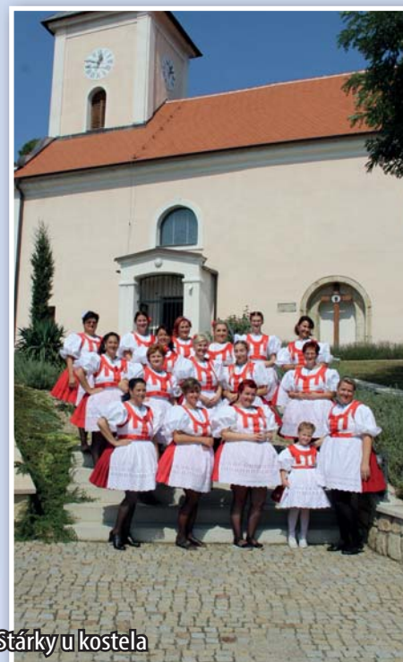
Stárky u kostela