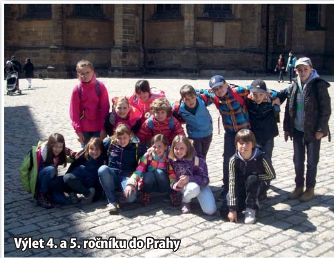
Výlet 4. a 5. ročníku do Prahy

Ve vaší vesnici 30. dubna vzplanula hranice, opékaly se buřtíky, náladu nepokazilo ani počasí. Tradice pálení čarodějnic je poměrně dlouhá a známá i v mnoha evropských zemích. Na hranici děti upálily figurínu čarodějnice, byly pro ně připraveny hry na hřišti, program začal průvodem čarodějnic ze školy. Akci pořádal obecní úřad spolu se ZŠ.