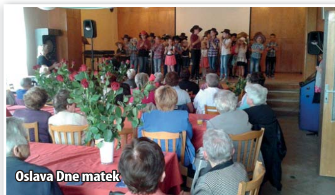
Oslava Dne matek