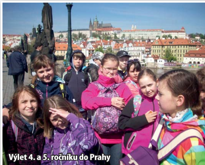
Výlet 4. a 5. ročníku do Prahy