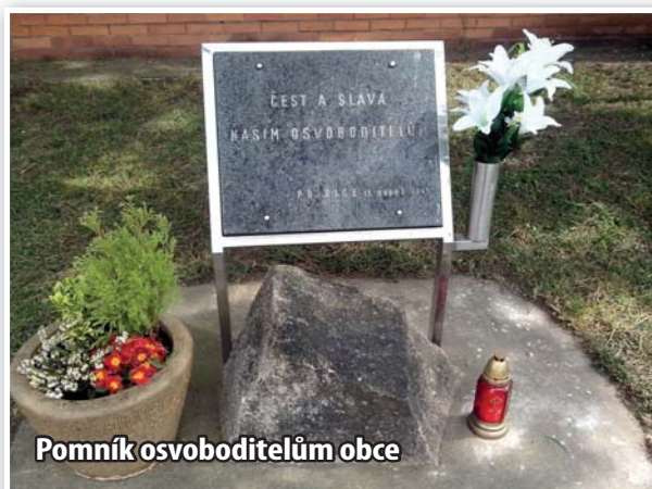
Pomník osvoboditelům obce

V pátek 17. dubna tomu bylo přesně 70 let, kdy byla osvobozena naše obec od nacistických okupantů. Umístěním praporu na obecním úřadě, položením kytičky a zapálení svíce k památníku osvoboditelů jsme si připomněli události jarních dnů roku 1945 a uctili památku padlých při osvobozování obce.