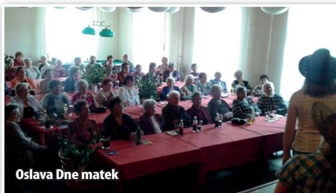
Oslava Dne matek